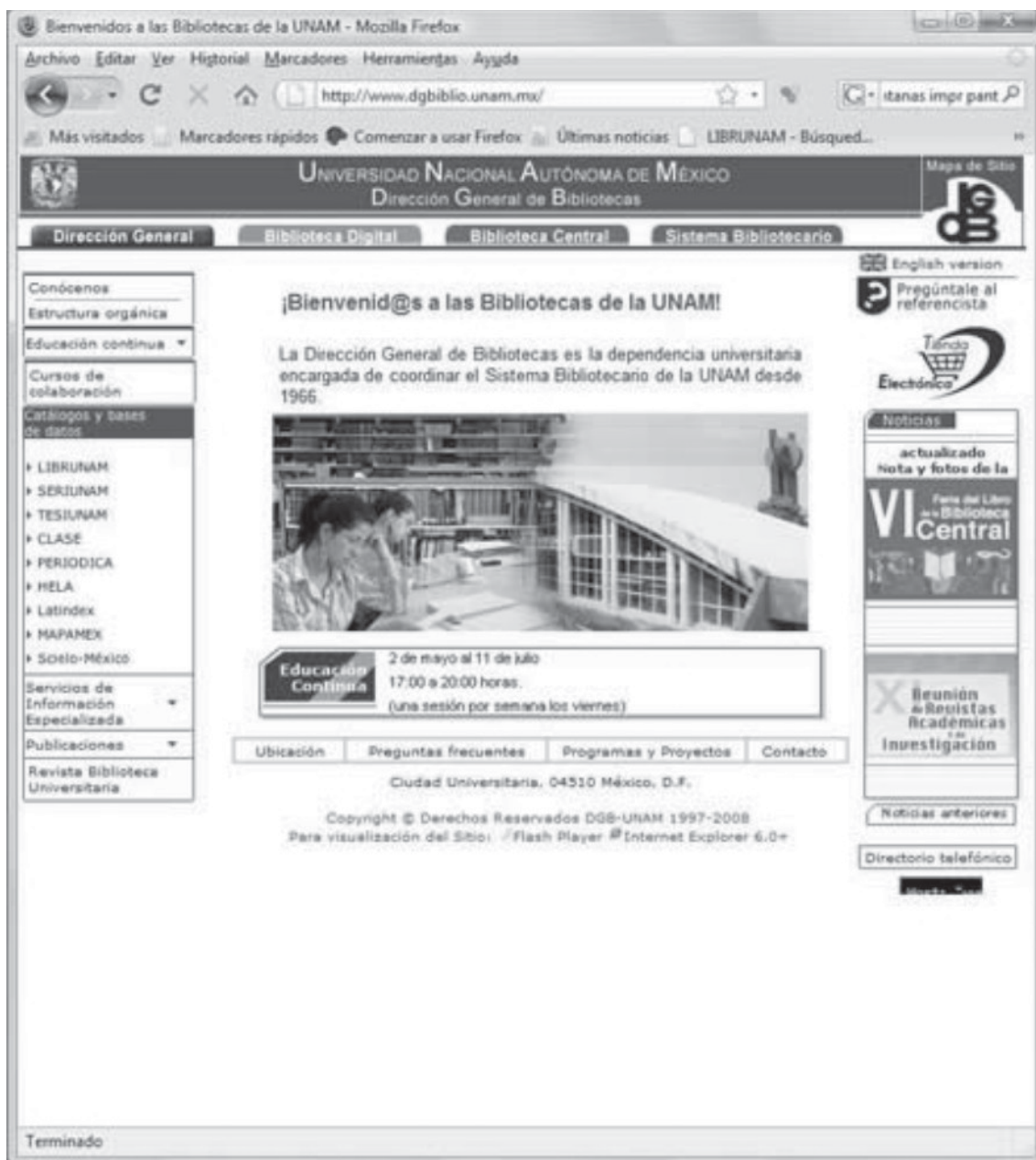
Fig. 4. Sitio de la Dirección General de Bibliotecas de la UNAM