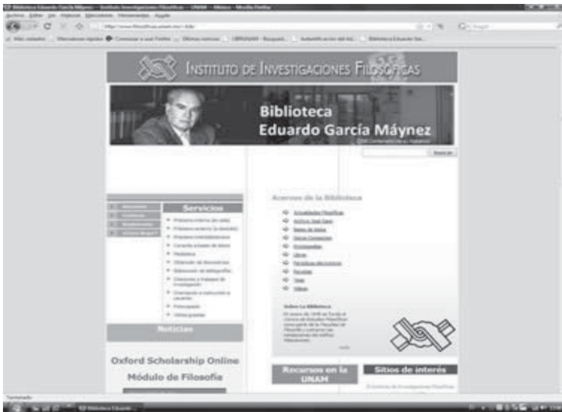
Fig. 1. Sitio de la biblioteca «Eduardo García Máynez»

Estudios Filosóficos* como parte de la Facultad de Filosofía y Letras en las instalaciones del edificio Mascarones, en la ciudad de México. Sin embargo, no fue hasta 1945 cuando se estableció la biblioteca del Centro de Estudios Filosóficos.