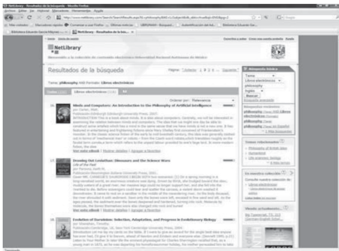
Fig. 2. Libros electrónicos de Netlibrary

En dicho proceso se revisaron más de 300 títulos especializados y se contó con la participación de dos investigadores del Instituto y dos profesionales de la bibliotecología, quienes revisaron minuciosamente los listados generados en cada una de las etapas, poniendo énfasis en datos relevantes como: títulos, autores, temas, editoriales y años de edición, entre otros; así como las líneas de investigación prevalentes en el Instituto. Finalmente fueron seleccionados 18 títulos en inglés, cuyos contenidos correspondían a la temática del proyecto de investigación que cubriría el costo de los mismos, es decir, gracias al apoyo y entusiasmo de los