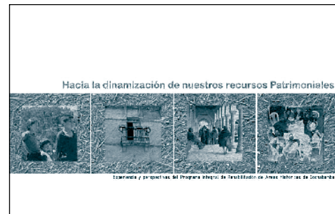
Tapá de la publicación "Hacia la dinamización de nuestros recursos patrimoniales. Experiencia y perspectivas del PRAHC"

Se trata de un compilado breve, que recoge tres artículos diferentes vinculados a la experiencia de trabajo y proyecciones del PRAHC-UMSS. El primer texto es: "Áreas de Acción del PRAHC-UMSS", se trata de un artículo