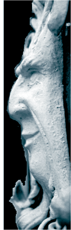
Mascarón típico de la Población patrimonial de Totorá (Municipio Totorá, Prov. Carrasco, Dpto. Cochabamba - Bolivia) tomado por el PRAHC-UMSS como logotipo

y social en estas temáticas, durante la gestión 2007, el PRAHC-UMSS generó una primera serie de publicaciones, que sistematizan su experiencia y producción acumulada. Así se editaron 3 documentos que se comentan a continuación.