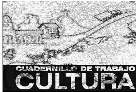
Tapa de la publicación “Cuadernillo de trabajo ‘Cultura’”

Tanto el cuadernillo de trabajo como la revista Finisterra, son publicaciones que rescatan los mejores ensayos y artículos desarrollados por los/as cursantes de la Maestría en Gestión del Patrimonio y Desarrollo Territorial (MGPDT) en sus versiones 2004, 2005 y 2006, sumando a ellas posicionamientos de expertos/as, de docentes invitados/as y asociados/as a la labor del PRAHC-UMSS. Esto responde a la concepción de integrar los procesos de capacitación con la producción y discusión del programa, permitiendo una revisión permanente de sus enfoques de abordaje hacia los entornos locales en los que interviene.