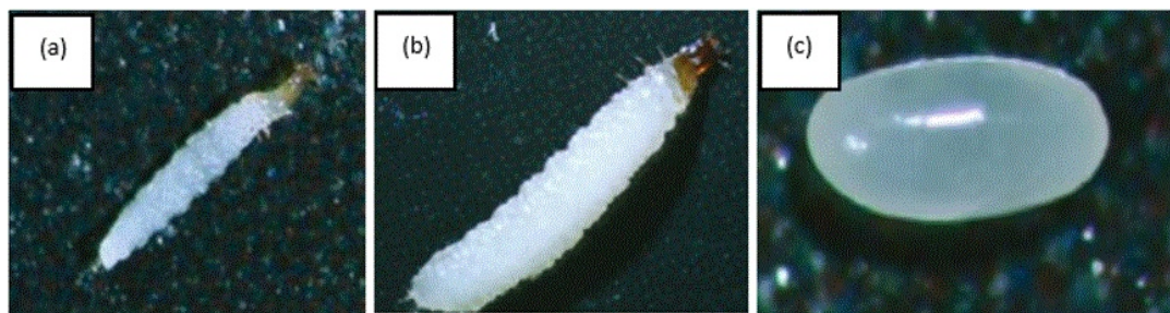
(a) 1er instar larval, (b) 2do instar larval, (c) Huevo

Figura 1 - Huevo y larvas de C. pumilio .