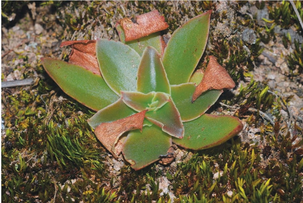
FOTO 2. Roseta de Echeveria aurantiaca .