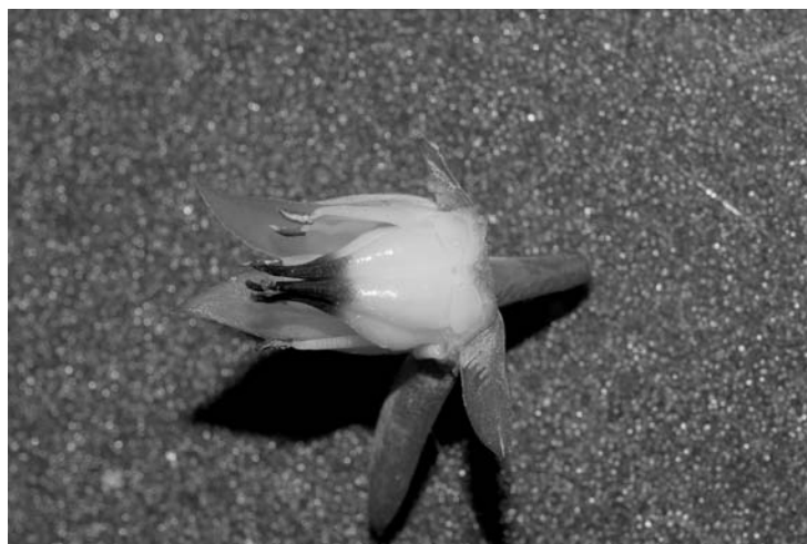
FOTO 6. Detalles de los pétalos, sépalos, gineceo, androceo y nectarios de Echeveria aurantiaca .

dos ramas, un solo tallo floral por ejemplar, flores anaranjadas con nectarios amarillos bien definidos pero hundidos, los segmentos de los pétalos dejan la base ensanchada que cubre los nectarios, el gineceo, nectarios y filamentos son amarillos.