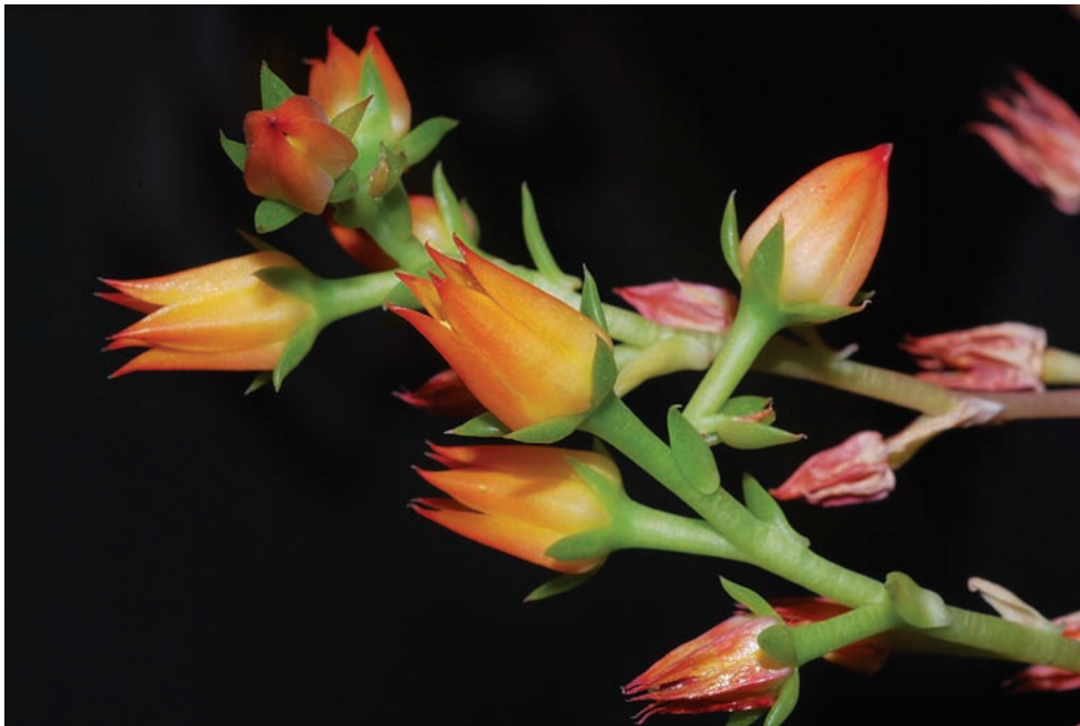
FOTO 3. Inflorescencia, pedicelos y flores de Echeveria aurantiaca .