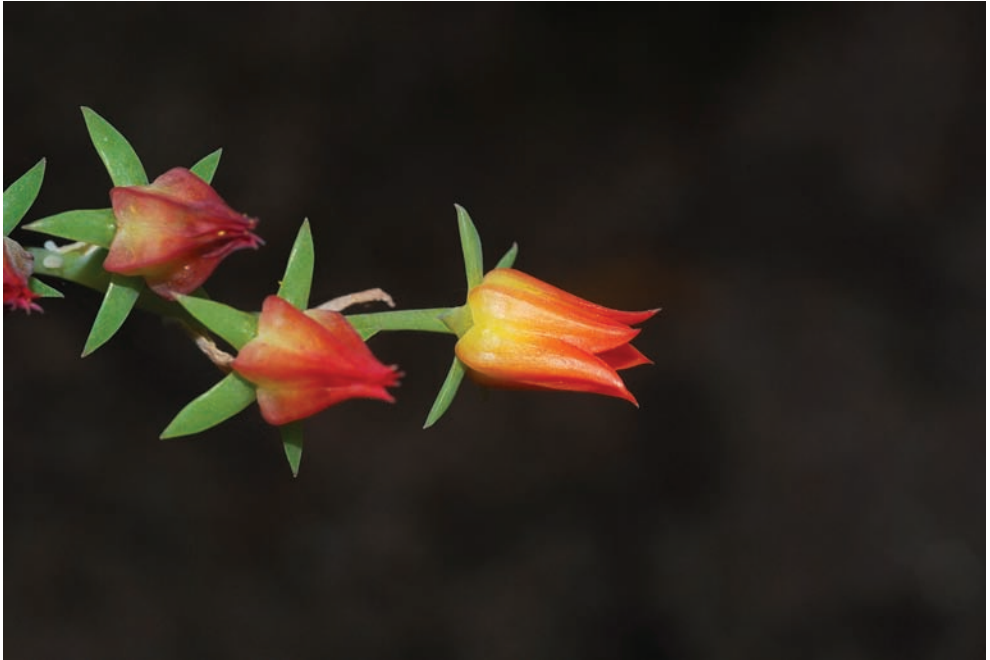
FOTO 4. Corola de Echeveria aurantiaca .