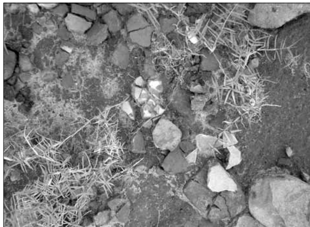
Figura 2. Afloramento de material arqueológico após a chuva.

Os moradores 6 antigos relataram, em suas entrevistas, o achado de moedas e miçangas na área das ruínas, durante a infância. Segundo D. Maria, funcionária aposentada da escola e ceramista, eles não guardavam os objetos encontrados. A sua descrição, assim como as de outros moradores, parece indicar que havia um volume tão significativo desses objetos, que eles eram abandonados no local. Para ela, essa expressiva quantidade de material indica que “devia ter muito índio porque tem muita missanga e eles gostavam de andar enfeitados”. Ela lamenta porque