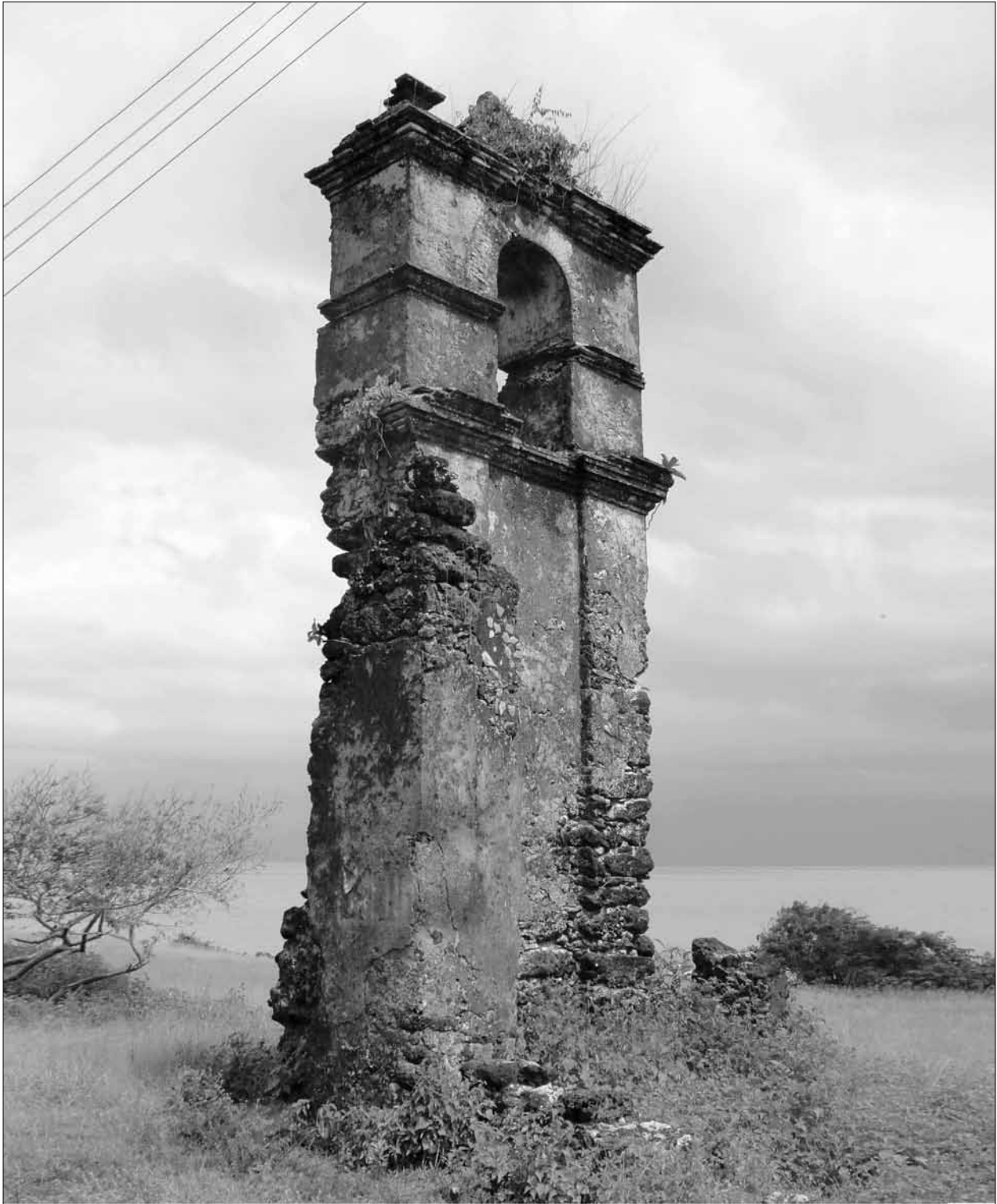
Figura 1. Sítio PA-JO- 46.