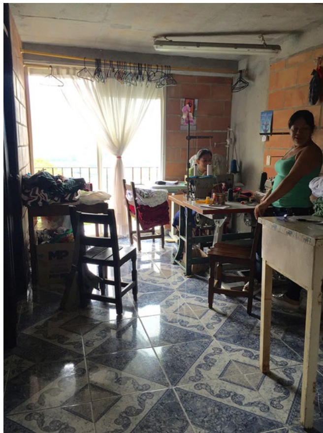
Imagen 2. Taller de confección en un apartamento del bloque 12

Ahora bien, si la habitabilidad se revisa desde la relación que se genera entre los sujetos, el entorno, y la manera como satisface sus necesidades y aspiraciones a partir de la vivienda, se identi-