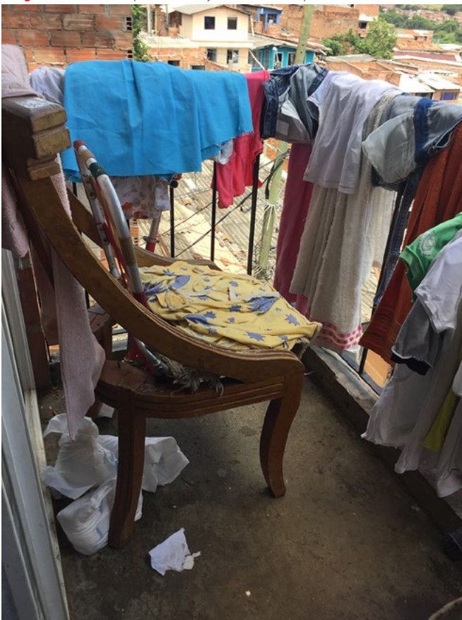
Imagen 3. Secado de ropa en balcón y fachada de un apartamento

Como parte de las situaciones que se identificaron en el día a día de estas personas, se encontró que muchas siguen haciendo un uso indiscriminado del agua, en especial, las que vivían antes dentro de la cañada y se conectaban de manera ilegal al tubo madre para obtener agua para lavar la ropa, preparar los alimentos, limpiar la casa o bañarse, sin tener que pagar nin-