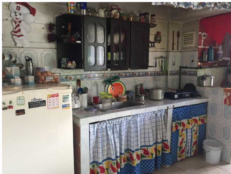
Imagen 1. Uso de las cortinas como sistema de división aérea.

Si se piensa que en 45 metros cuadrados se debe acomodar una cocina, un patio de ropas, tres habitaciones, un baño y un balcón, la cortina se convierte en una pieza versátil para remplazar todos los elementos que no hacían parte de la entrega oficial de los apartamentos, pero que sí eran necesarios en el ámbito doméstico de acuerdo con los requerimientos de sus habitantes tal y como se ve en la siguiente imagen (véase Imagen 1).