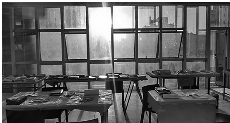
Laboratorio de emergencia constituido ante inundación en Biblioteca de Historia, UNR/2017

atravesando nos regala, empero, una buena oportunidad para fortalecer el diálogo entre las universidades públicas de nuestra América. Momento de actuar para darnos respuestas que nazcan de nuestros propios territorios, en sus contextos históricos, reales y situados. Tenemos en nuestras manos la posibilidad de construir un nuevo espacio para trabajar colectivamente por una agenda de trabajo comprometida con la inclusión de los sectores más postergados y con las miras puestas en la soberanía de nuestros pueblos latinoamericanos. ■