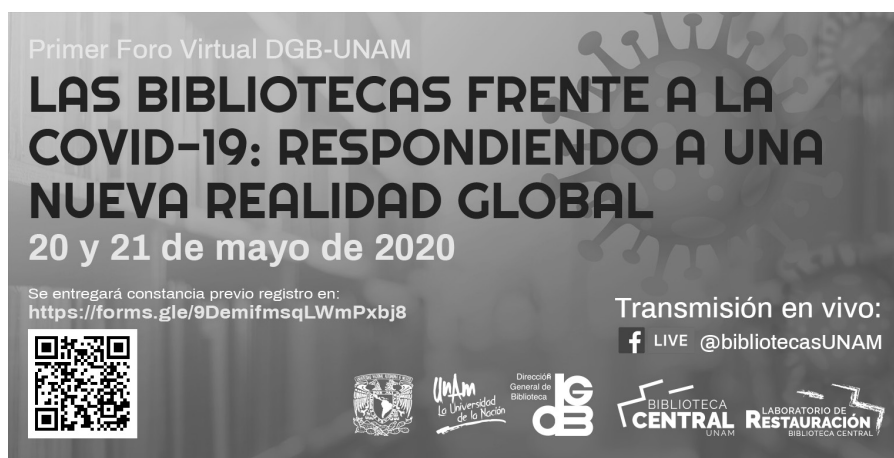
Primer Foro Virtual DGB-UNAM

Sobre lo último, la Biblioteca Nacional de Colombia (BNC) ha realizado una serie de recomendaciones donde destaca la implementación de un servicio de información local virtual sobre la emergencia sanitaria a través de la recopilación de información y canales de atención en los municipios. Ciertamente, alienta la difusión de las buenas prácticas, estrategias creativas y recursos virtuales implementados por las redes bibliotecarias de cada país. Finalmente, enfatiza que este contexto puede ser aprovechado para diseñar, crear y fortalecer servicios, programas y modalidades virtuales que sostengan el vínculo con la comunidad en medio de esta crisis sanitaria internacional. 9