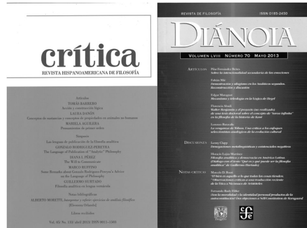
Revistas del Instituto de Investigaciones Filosóficas