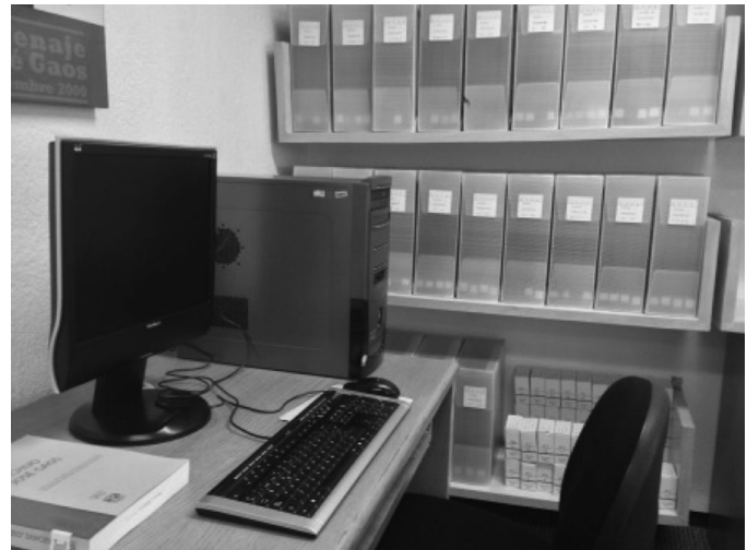
Área de Archivos

A partir de 1997 se han recibido diversos documentos, a los que independientemente de su procedencia se les ha concentrado en la Serie CUATRO , que se forma de 13 carpetas. También, en el año 2000 la Biblioteca Nacional de México fumigó las cuatro series. En 2006 en el Fondo Gaos se realizó la conversión de la base Gaos en ISIS al programa Aleph.