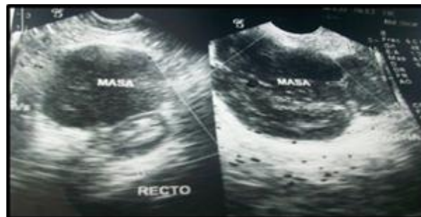
Figura 1. Ultrasonido región rectal y ultrasonido región perianal (imagen que mide 4,82 x 6,70 x 6,87 cm, volumen de 116,15 ml).

Presentamos el caso de una paciente femenina de 41 años de edad, con hábitos alcohólicos ocasionales y tabáquicos desde los 23 hasta los 37 años, la paciente acude a la consulta del servicio de cirugía del Instituto Venezolano de los Seguros Sociales, por presentar tumoración en región perineal derecha con ocho meses de evolución que ha aumentado de tamaño y tiene como concomitante dolor. A la exploración clínica se encuentra en la inspección nódulo perianal derecho con bordes definidos, de aproximadamente 4cm x 6cm, que se extiende desde la fosa isquiorrectal derecha hasta la pared lateral de la vagina y recto derecho, de