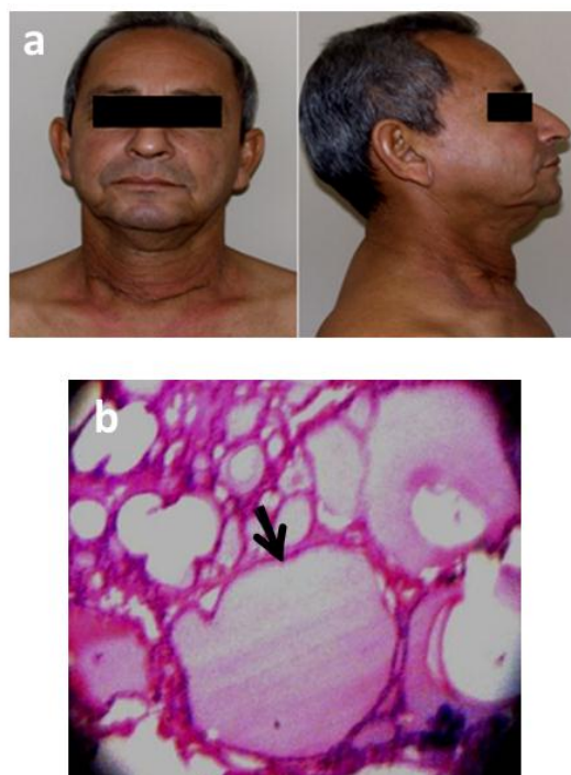
Figura 2. 2a. Corresponde a fotografías postoperatorias, se observa la recuperación de la forma y simetría del cuello. 2b. Se evidencia en estudio histológico folículos distendidos por coloide y revestimiento epitelial aplanado.

Los avances en los estudios de imágenes han tenido un papel fundamental en la evaluación perioperatoria de la glándula tiroidea. El ultrasonido (US) y la punción guiada por ultrasonido son las técnicas de imágenes más útiles en el diagnóstico del bocio. Es seguro, no invasivo y accesible. Los detalles sobre el contenido de las lesiones, bordes, calcificaciones, ecotextura y vascularidad pueden aportar una valiosa información para evaluar una lesión maligna (9,10). La Tomografía Computarizada y la Resonancia Magnética (RM) son útiles para evaluar la extensión de la enfermedad, el componente subesternal y la relación de la glándula con otras estructuras (10,11). En este caso el US demostró características compatibles con enfermedad benigna. La RM aportó datos sobre el calibre y la desviación de la tráquea, aspectos importantes para el anesestesiólogo al momento de realizar la intubación.