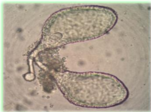
Figura 4. Microfotografía de las glándulas salivales de Lutzomyia migonei . 400X

El maxadilán es el vasodilatador más potente encontrado en la naturaleza, identificado en la saliva de L. longipalpis , a su vez incrementa la producción de IL6, IL4, IL10 y PGE2 y disminuye la producción de IL12, IFN- \gamma , TNF- \alpha y NO. La IL4 por su parte activa a los macrófagos, incrementa IL10 y la inosina, mientras