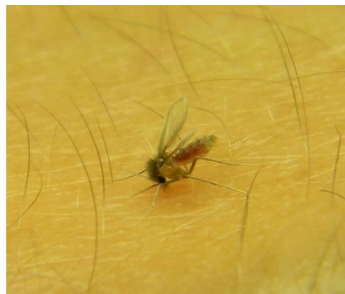
Figura 3. Microfotografía de Lutzomyia migonei realizando la hematofagia.”.

Por otra parte, la saliva del flebotomino