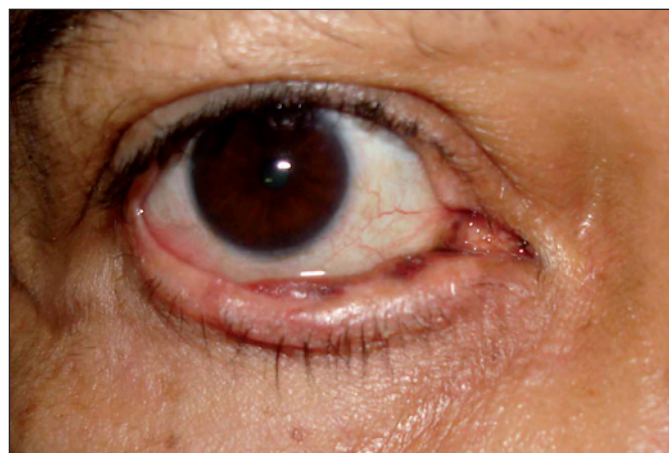
Figura 1 - Aspecto da lesão pigmentada na margem palpebral e conjuntiva bulbar inferiores e carúncula no olho direito

Optou-se pela exérese da lesão da margem palpebral com auxílio de pinça hemostática, dissecação para liberação das margens da incisão e sutura de aproximação das margens cirúrgicas.