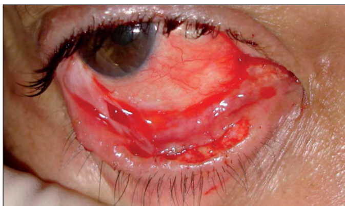
Figura 4 - Aspecto da margem palpebral após remoção da lesão e sutura de aproximação das margens

Evidencia-se a importância dos exames complementares, neste caso a citologia de impressão, considerada relativamente simples e pouco onerosa, possibilitando recursos diagnósticos seguros. Trata-se de uma técnica citológica que apre-