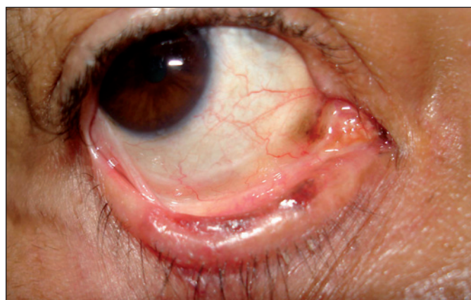
Figura 2 - Lesão na pálpebra inferior direita à eversão palpebral. Nota-se lesão com pigmentação difusa, aspecto ulcerado e irregular e bordos elevados.