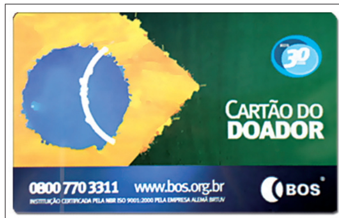
Figura 1 - Cartão do doador de córneas

O BOS-Banco de Olhos de Sorocaba, entidade filantrópica, fundado em 1979, se tornou o principal captador de córneas do