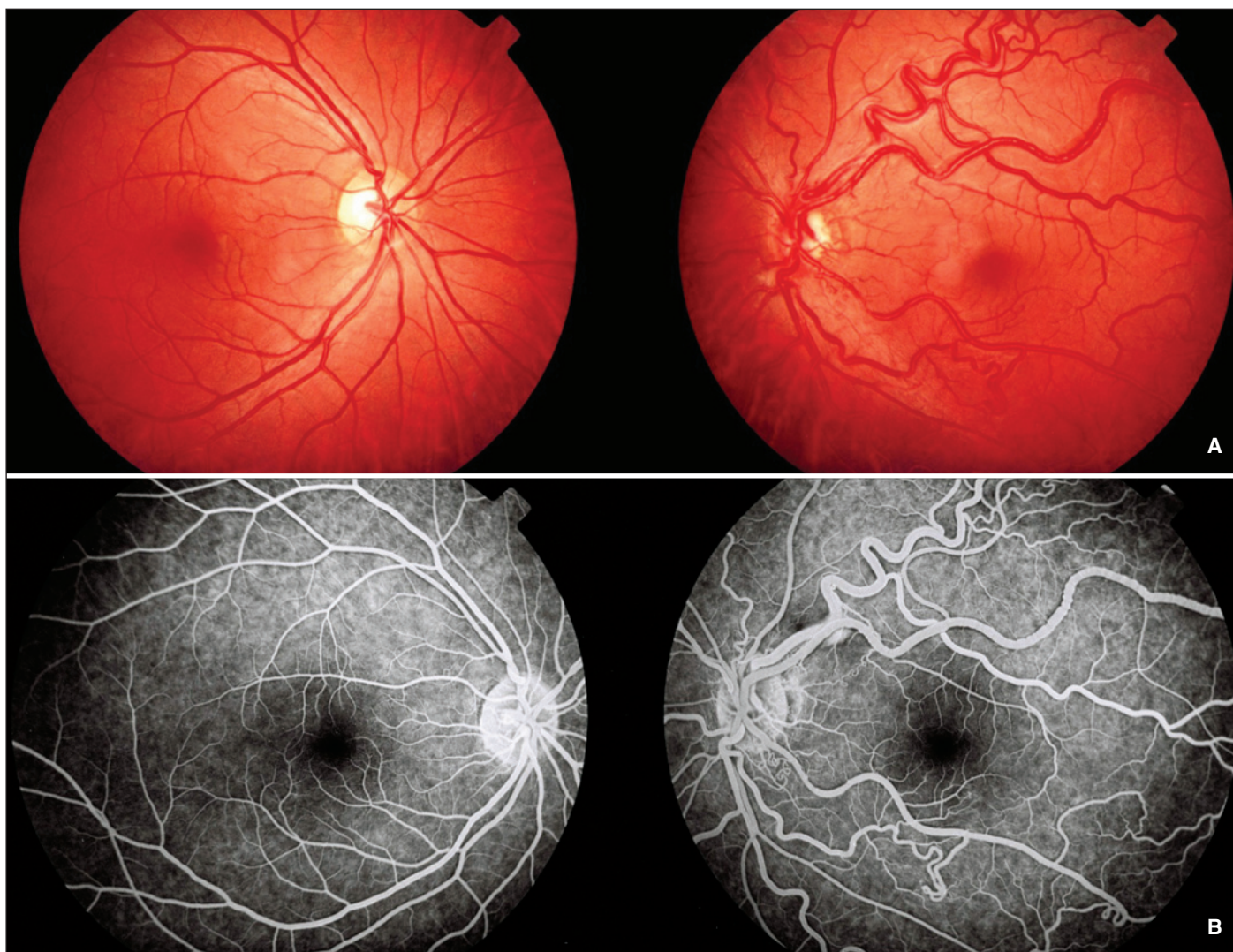
Figura 1 - A) Retinografia normal no olho direito e olho esquerdo apresentando grande dilatação de vasos retinianos, aumento da tortuosidade e nítidas comunicações arteriovenosas; B) Angiofluoresceinografia normal no olho direito e evidenciando dilatação de grandes vasos com aumento da tortuosidade e comunicações arteriovenosas peripapilares no olho esquerdo

A presença de alterações vasculares características (hemangioma racemoso) na retina torna mandatória a busca por lesões intracranianas de mesma natureza, uma vez que existe relação direta da extensão do comprometimento retiniano e a probabilidade de lesões vasculares intracranianas. Cerca de 90% dos pacientes com acometimento grave na retina e consequente baixa AV apresentam também lesões vasculares no sistema nervoso central (3) .