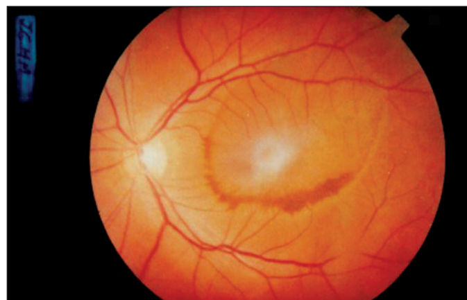
Figura 2 - Fotografia do polo posterior 7 dias após tratamento, mostrando reabsorção da hemorragia pré-retiniana e membrana epirretiniana

Apesar dos bons resultados da vitrectomia na síndrome de Terson, complicações como descolamento de retina, diálise de retina, roturas retinianas e membranas epirretinianas são relacionadas (3) . Métodos alternativos de tratamento da hemorragia intraocular são descritos. Drenagem da hemorragia pré-retiniana com laser de argônio (4) ou Nd: YAG laser (5) no vítreo são viáveis, porém, complicações como buraco macular e descolamento de retina foram observadas (5) .