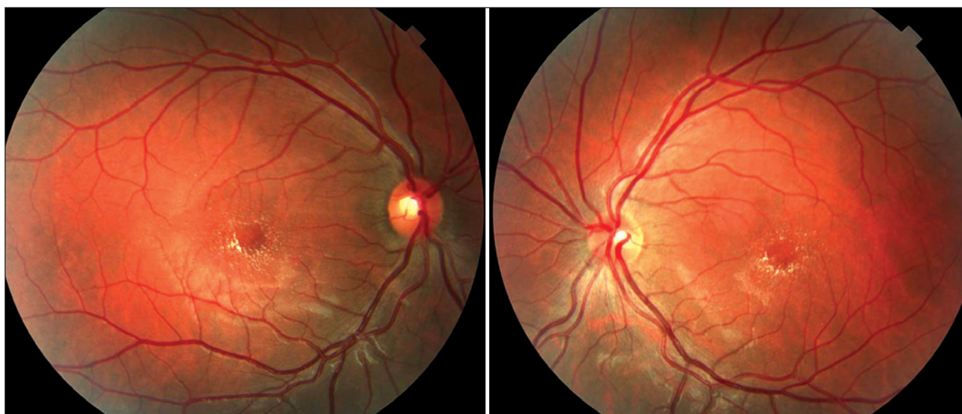
Figura 1 - Retinografia colorida mostrando o padrão dos depósitos cristalinos ao redor da fóvea

O exame de tomografia de coerência óptica (OCT) foi empregado recentemente em pacientes com SSL. Dois estudos descreveram as características maculares de pacientes com a síndrome, sendo descritas alterações ao OCT em todos os pa-