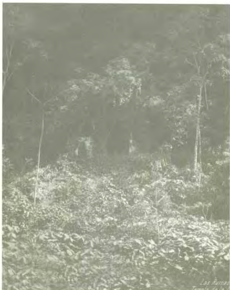
Las Ruinas Templo de la...