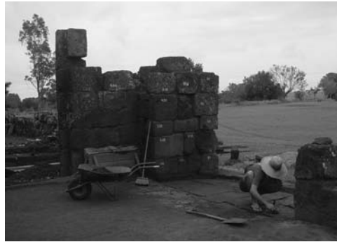
Figura 16: Interior de la fachada principal, iglesia San Juan Baptista, obras de 2005.

Como resultados de este programa, además de la capacitación e intercambio por medio de cursos-talleres realizados en Brasil, Argentina y Paraguay, fue propuesta la elaboración de planes de manejo integrados, en los que se promoviera el desarrollo turístico-cultural para la región.