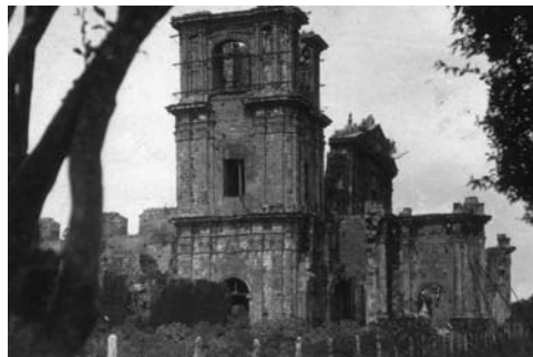
Figura 3: Vista este de la Iglesia después de la estabilización e implantación del alambrado de protección, São Miguel das Missões (1927-1938).

Fuente: Arquivo Escritório Técnico, IPHAN, São Miguel das Missões.