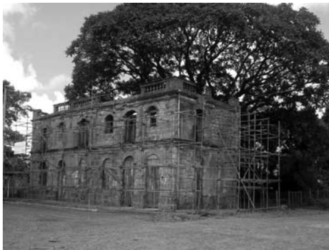
Figura 20: Taller del curso de restauración de cerámica arqueológica (2005).