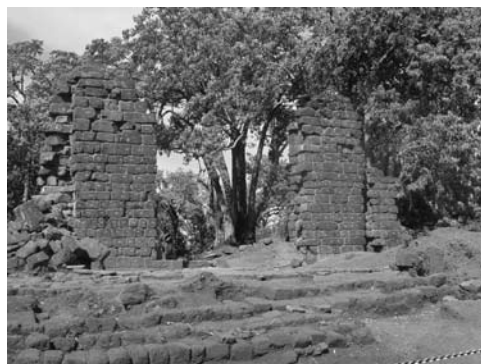
Figura 18: Fachada principal, iglesia San Lorenzo, obras de 2004.