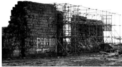
Figura 10: Estructuras estabilizadas en la Iglesia de São Nicolau (1988).

Con el objeto de preservar los remanentes arqueológicos y su ambiente, el proyecto fue concebido para definir un nuevo acceso al sitio –recuperando la simbología del acceso frontal de la antigua reducción– en un terreno topográ-