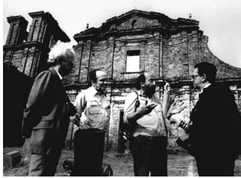
Figura 8: Inicio de los trabajos de consolidación de la iglesia de São Miguel, entrenamiento de obreros en técnicas constructivas tradicionales (1981).