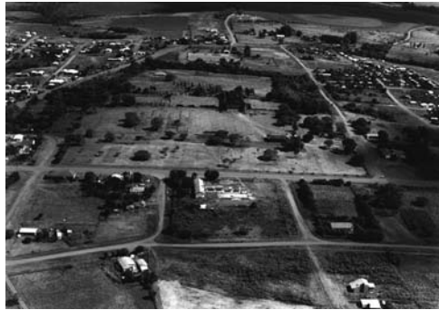
Figura 14: Consolidación en los talleres, San Miguel Arcángel, obras de 2002.