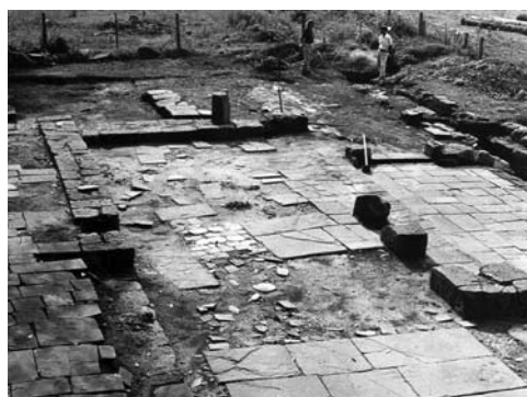
Figura 6: Excavación arqueológica en la Iglesia de São Nicolau (1980).