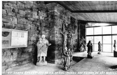
Figura 5: Unidad del museo construida en el interior de la iglesia (1955).