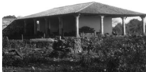
Figura 4: Vista del Museu das Missões, casa do zelador y cruz missioneira (1940).

La Fundación Nacional Pró-Memória editó con recursos de la UNESCO una obra del arquitecto Ramón Gutiérrez, donde se publican documentos iconográficos existentes en la Biblioteca Nacional de Río de Janeiro y Archivo Histórico do Itamaraty, en Río de Janeiro (Gutiérrez, 1987), con versiones en portugués, español, francés e inglés, una evidente contribución al proceso de conocimiento y difusión de las misiones.