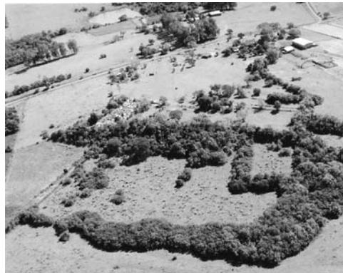
Figura 11: Vista aérea del Sitio de São João Batista (2004).