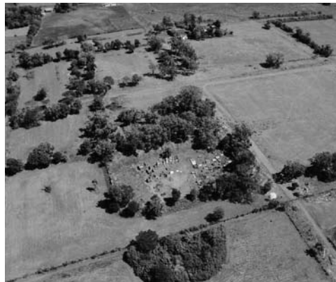
Figura 12: Vista aérea del Sitio de São Lourenço Mártir (2004).