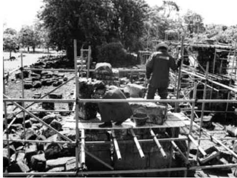
Figura 15: Interior, iglesia San Juan Baptista, obras de 2005.

Autor: Matilde Villegas. Fuente: Arquivo Escritório Técnico, IPHAN, São Miguel das Missões.