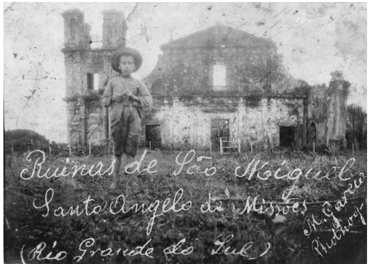
Figura 2: Ruínas de la Iglesia de San Miguel Arcángel (1932).

Sobre los remanentes de tres de los pueblos que pasaron a integrar el territorio brasileño –San Borja, San Luís Gonzaga y Santo Ángel Custodio– fueron construidas nuevas ciudades, encubriéndolos totalmente. En San Nicolás fueron preservadas partes de la iglesia, de la casa de los padres y del cabildo, dentro de la plaza de la nueva fundación implantada en el inicio del siglo XX. Los remanentes del pueblo misionero de San Miguel Arcángel permanecieron en el campo hasta 1928, cuando fue definido el trazado urbano para la nueva villa de São Miguel das Missões. Este proyecto reservó una pequeña área para las ruinas de la iglesia. La escasa ocupación demo-