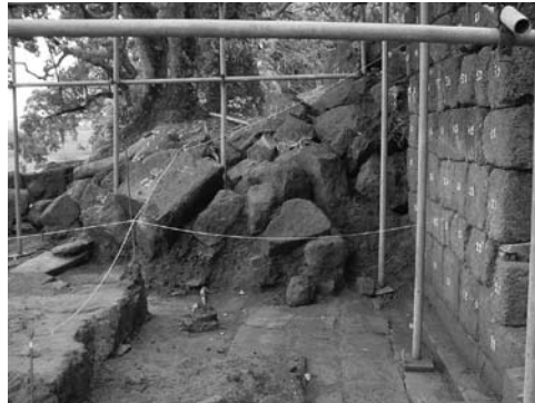
Figura 17: Excavación en el atrio, iglesia San Lorenzo, obras de 2004.