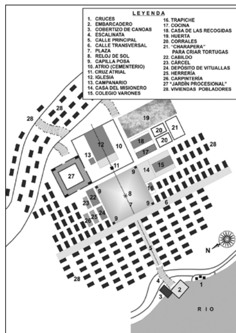
Figura 2: Traza hipotética de una reducción en la misión de Maynas durante el siglo XVIII, elaborada a partir de descripciones realizadas por diversos misioneros cronistas (2004).

11 Estas cartas fueron consultadas por Constantino Bayle con la intención de escribir