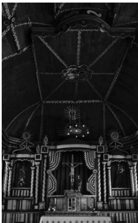
Figura 5: Detalles constructivos de la sacristía de Dalcahue.