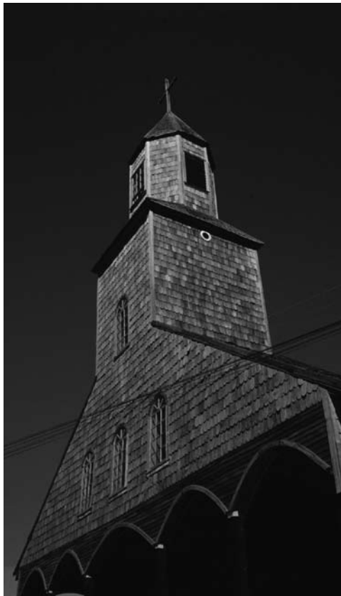
Figura 2: Iglesia de Achao, la única que subsiste de la “Misión Circular” de los jesuitas.

Posteriormente a la misión a Nahuel Huapí se encararía la evangelización de la isla de Guar hacia 1710, repoblada por indígenas procedentes de Chonos (Mansilla, 1991). Los jesuitas instalaron allí una capilla de San Felipe y una casa misional que fue abandonada en 1718 aunque continuaron con misiones anuales. La migración de los chonos significó superar largos años de conflictos étnicos con los chilotas y adaptarse a un modo de vida sedentario y pacífico (Olivares, 1874). A pesar de las promesas de ayuda oficial, aparentemente