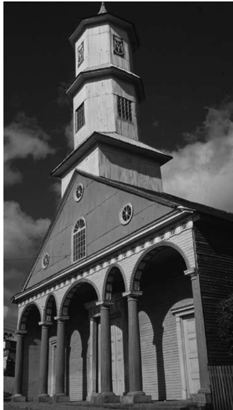
Figura 3: Iglesia de Chonchi. El nuevo lenguaje clasicista de los siglos XIX y XX.