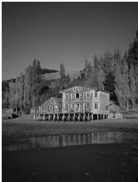
Figura 8: Arquitectura maderera palafítica en las islas de Chiloé.

El pueblo formado en la pampa de Teque e inmediato al Fuerte Real se permitía en algunos casos perforar los centros de manzana, mantener la plaza cuadrada, pero hacer rectangulares las manzanas y proponer casi exentos los edificios públicos relevantes (Rodríguez y Pérez, 1947, p. 219).