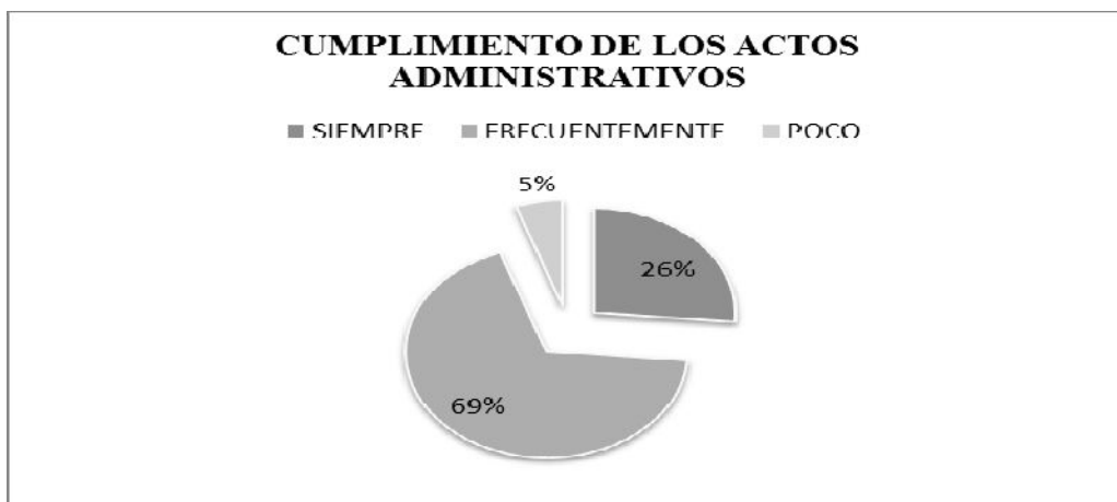
Gráfico III. El nivel de cumplimiento de los municipios