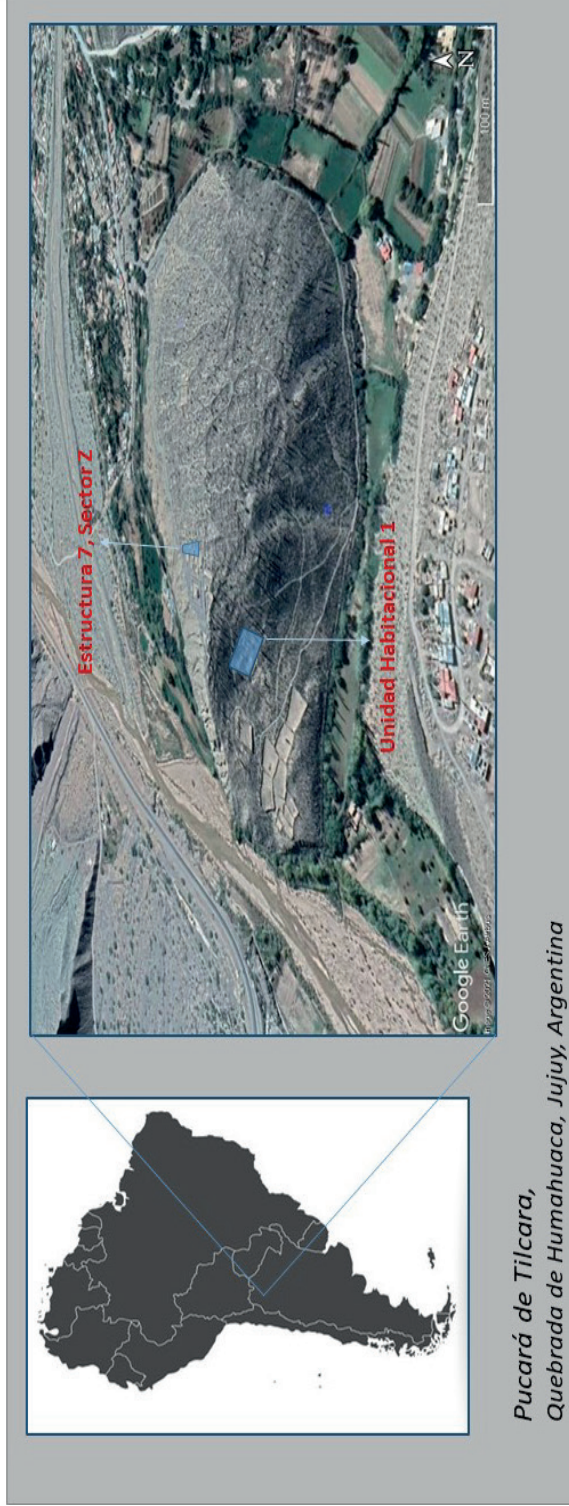
Figura 1. Ubicación del sitio arqueológico Pucará de Tilcara