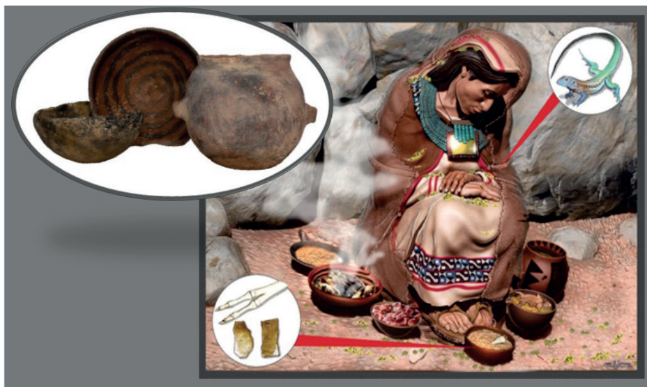
Figura 5. Representación gráfica del individuo femenino recuperado en la cima del Pucará de Tilcara con su acompañamiento mortuario

54 ■ Nota: ollita Humahuaca-Inca N/R, placas de oro, cuentas de collar, una mandíbula de un cuis doméstico ( Cavia Porcellus sp) (López Geronazzo et al. 2019), y los huesos de una extremidad de un lagarto de la familia teiidae ( Salvator merianae o Teius teyu ), pucos de estilo Interior Negro Pulido y Humahuaca-Inca N/R, uno de ellos decorado en su interior por una figura espiralada.