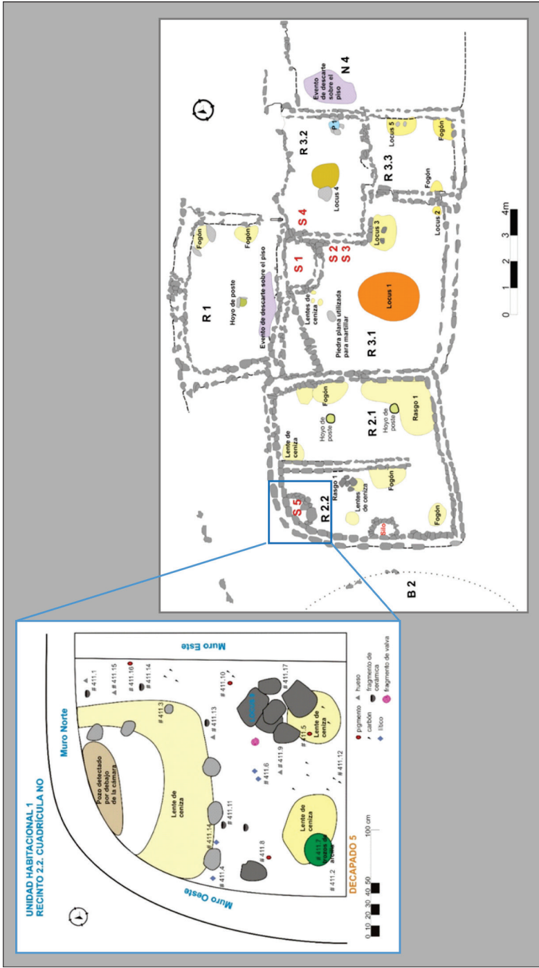
Figura 4. Unidad habitacional 1. Planta y detalle del Recinto 2.2