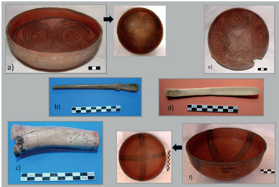
Figura 3. Piezas arqueológicas que ejemplifican el acompañamiento mortuorio

Nota: a) Pucos Humahuaca negro sobre rojo; b) cucharilla de hueso (Pieza 36165); c) húmero de camélido grabado, posible sección de las conocidas “trompetas” (Pieza 35160, Yacimiento 19); d) espátula de hueso para inhalar alucinógenos; e) y f) pucos Humahuaca-Inca negro sobre rojo.