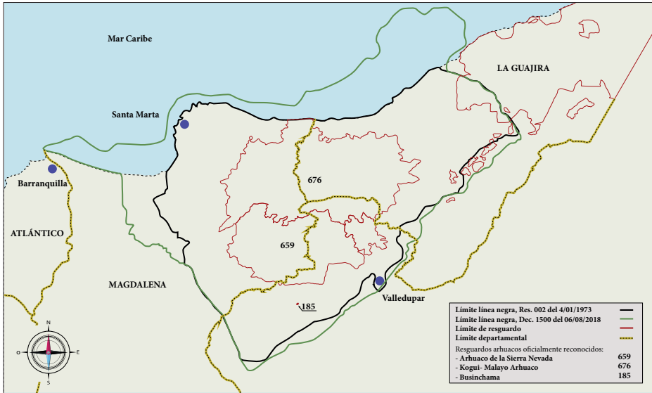
Figura 1. Delimitación del territorio del pueblo arhuaco

Fuente: elaboración propia a partir del análisis de la investigación de la autora, 2022.