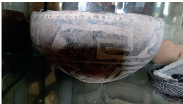
Figura 4. Detalle de guardas en pieza de cerámica encontrada en el territorio

Potrero, Pueblo Tolombón, provincia de Tucumán, Argentina, 27 de julio de 2017.