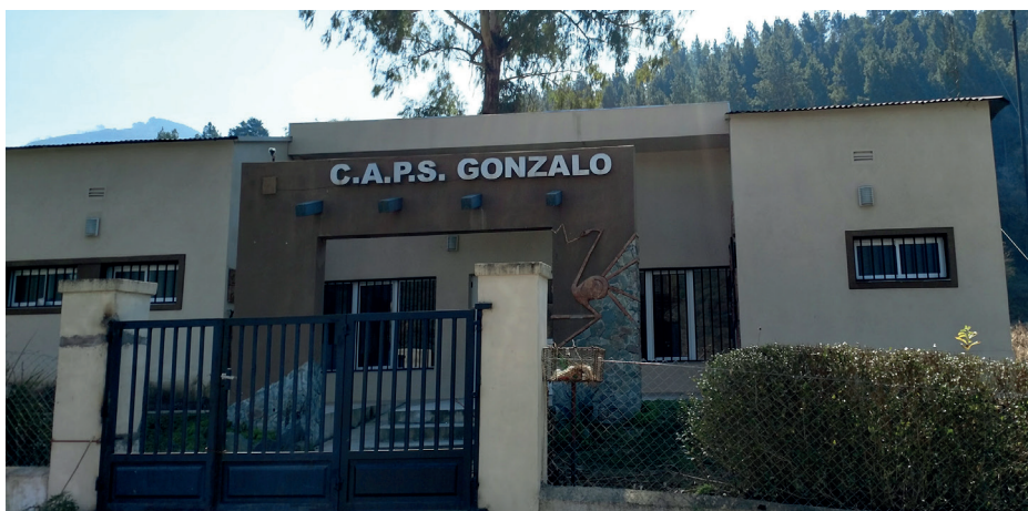
■ Fuente: fotografía de la autora, base Gonzalo, Pueblo Tolombón, provincia de Tucumán, Argentina, 2017.