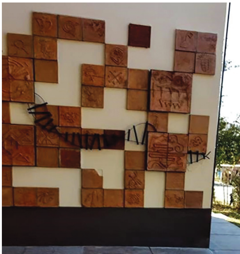
Figura 2. Fachada del Centro de Atención Primaria de Salud con simbología diaguita