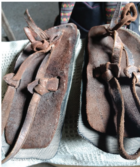
Figura 6. Calzado seleccionado para exposiciones en la escuela de Potrero

Fuente: fotografía de la autora, Potrero, Pueblo Tolombón, provincia de Tucumán, Argentina, 2018.