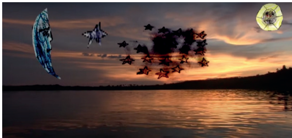
Figura 2. Luna, Yatsi Mirikua y las estrellas contaminadas de petróleo