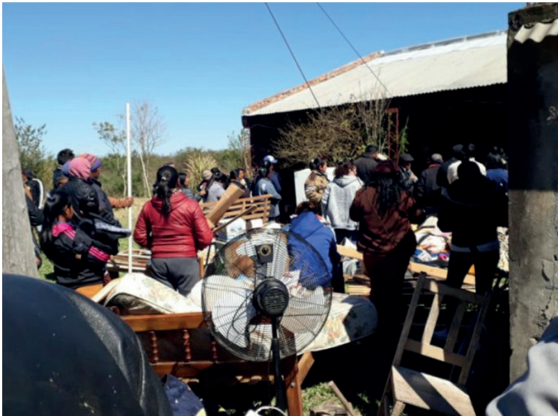
Figura 3. Desalojo de la familia R-S