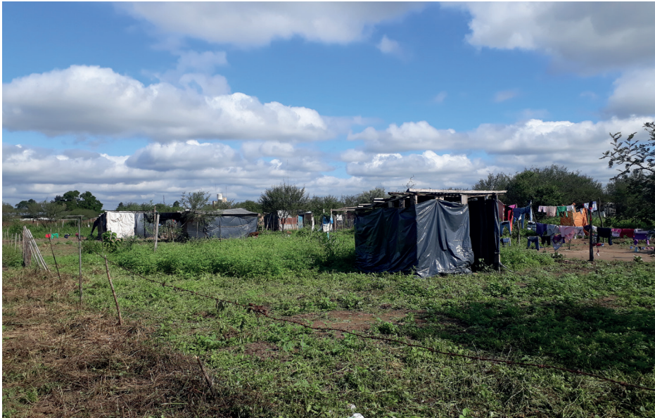
Figura 2. Toma de tierras en Pampa del indio