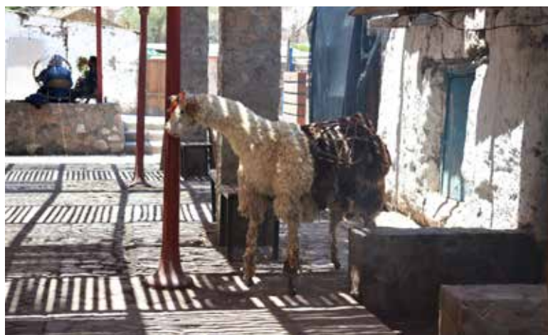
Figura 3. Imagen alusiva al ganado camélido vinculado a la práctica marchante, pueblo de Guañacagua