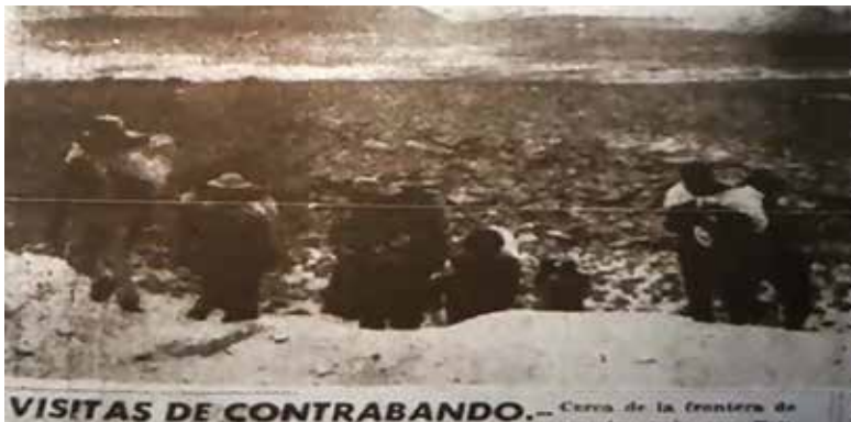
Figura 4. Representación gráfica de un conjunto de personas andinas caminando en la frontera Bolivia-Chile