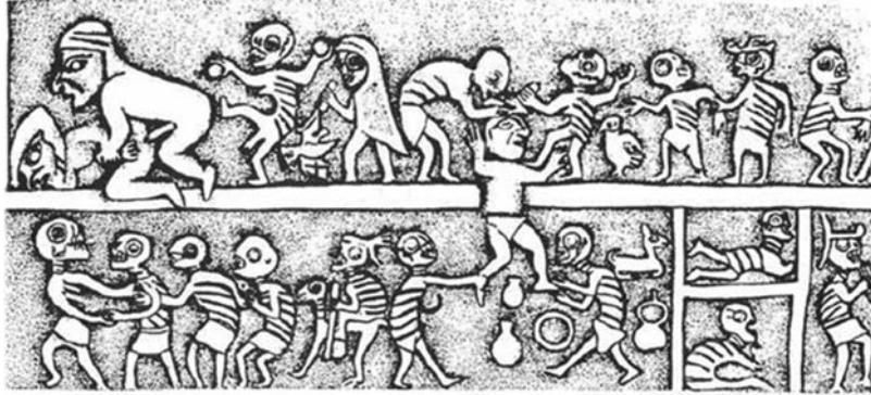
Figura 3. Cena de união sexual no ambiente dos mortos

Fonte: Goepfert 2008 citado por Donnan 1982.