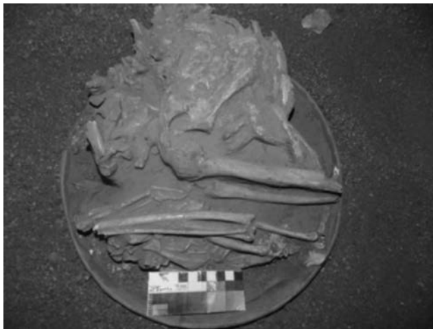
Figura 5. Indivíduo inumado (sepultura 166) em recipiente cerâmico com uma ave de rapina associada (em detalhe)

Um fato que distingue essa sepultura da do sepultamento 119, na qual foram depositados vasilhames cerâmicos que recobriam a região cranial e abdominal do indivíduo humano, com o esqueleto do animal, refere-se à inumação dos indivíduos (humano e animal) dentro de uma peça cerâmica. Embora exista um ponto em comum entre as duas sepulturas, a presença de animais completos (com ausência de alguns ossos devido à dispersão e a agentes tafonômicos), com esqueleto articulado e em conexão anatômica. Quanto ao esqueleto humano da sepultura 166, foi evidenciada uma ave de médio porte, cujas análises morfológicas -em particular do bico, alongado, ligeiramente recurvado e pontiagudo- apontaram para uma ave de rapina (figura 5). As observações realizadas sobre o exemplar faunístico não foram bem-sucedidas na determinação de espécie. No mesmo sentido, as análises resultaram em informações aproximadas, em virtude de o conjunto sepulcral ter sido completamente recoberto por resina acrílica (Paraloid), o que impossibilitou a inumação completa da sepultura. Em estudos posteriores, procedeu-se com a remoção química e mecânica dessa resina acrílica (Cardoso 2015), contudo se observou que a continuidade do procedimento comprometeria a integridade das peças ósseas; assim, o procedimento foi interrompido.