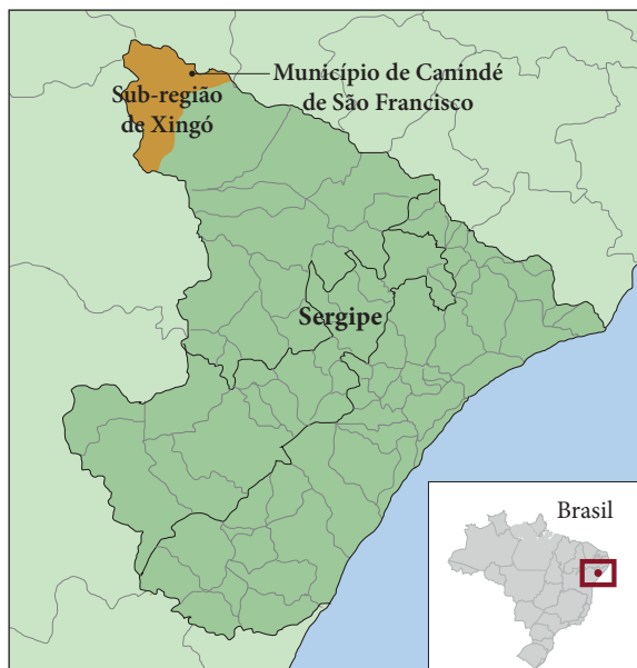
Figura 1. Localização do município de Canindé de São Francisco, Sub-região de Xingó, Sergipe, Brasil