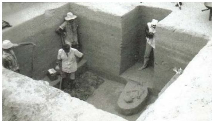
Figura 2. Escavação no sítio arqueológico Justino