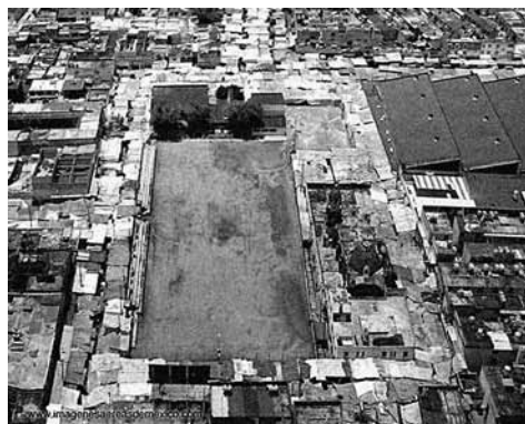
Foto aérea de Tepito y del Maracanã (Cancha de fútbol y gimnasio de Tepito)