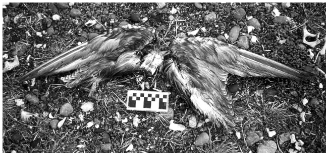
Figura 3. Restos articulados de un juvenil de gaviota cocinera ( Larus dominicanus ).