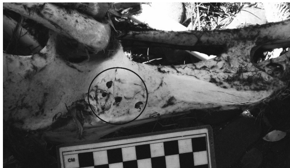
Figura 4. Sinsacro de ñandú petiso ( Rhea pennata ) con modificaciones efectuadas por cánidos. El círculo señala la zona afectada.

completa, y los huesos con más probabilidades de sobrevivir son los correspondientes a las extremidades anteriores y la porción distal de las posteriores (Cruz, 2000a, 2005, 2007b).