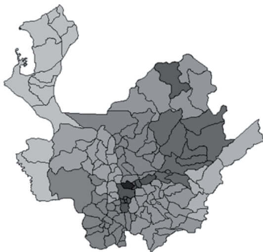
Figura 1. Mapa del departamento de Antioquia, al noroccidente de Colombia.

El municipio de Bello es uno de los diez municipios que conforman el área metropolitana del Valle de Aburrá en el departamento de Antioquia. Limita al norte con el municipio de San Pedro de los Milagros, al oriente con Copacabana, al occidente con Medellín y al sur con Medellín y San Jerónimo.