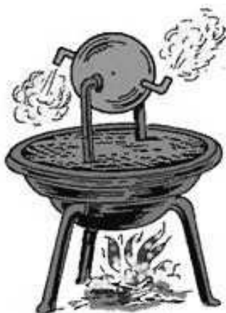
Figura 1: Máquina de Heron

Em 1690 o físico Francês Denis Papin (1647-1712) idealizou os princípios de funcionamento de uma máquina a vapor. Segundo ele, “desde que é propriedade da água que uma pequena quantidade dela torna-se vapor pelo calor e que tem uma força elástica como a do ar, mas que sucede pelo frio ser novamente transformada em água, de maneira a que não fiquem traços da dita força elástica, concluí que podem ser construídas máquinas enquanto água, com auxílio de calor não muito intenso e com pequeno custo, poderia produzir o perfeito vácuo, que não se poderia obter por meio da pólvora” (PAPIN APUD FORBES, 1958, pág. 100)