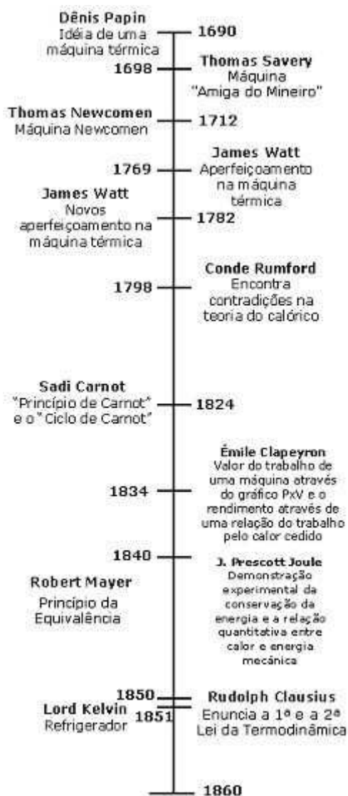
Figura 4: Linha do Tempo do Desenvolvimento da Termodinâmica

Vemos pelas contribuições citadas até agora que o desenvolvimento da ciência da termodinâmica se deveu a diversos personagens, que o processo de construção foi lento e que a termodinâmica só veio a consolidar como ciência na década de 1850. Na Figura 4, temos uma linha do tempo do desenvolvimento da termodinâmica na qual estão presentes tanto os principais personagens deste período quanto alguns dos principais conhecimentos abordados e das máquinas a vapor citados no texto.