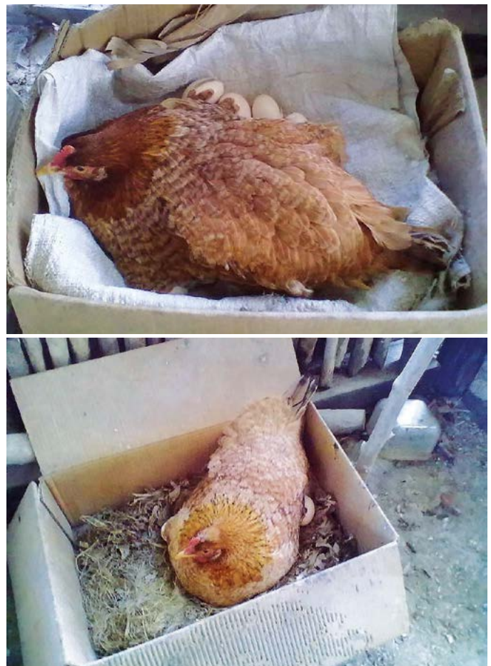
Figura 5. Cloquez o anidamiento de las gallinas criollas ( Gallus gallus ).

La alimentación de las aves de traspatio consiste en lo que las aves pueden recoger como hojas, hierbas tiernas, forrajes, insectos, sobrantes de comida, frutas y tortilla los cuales deben ser del día para evitar enfermedades de tipo digestivo. También se proporcionan granos como maíz, trigo, sorgo o arroz los cuales utilizan estas familias para su consumo. Se ha observado que existen