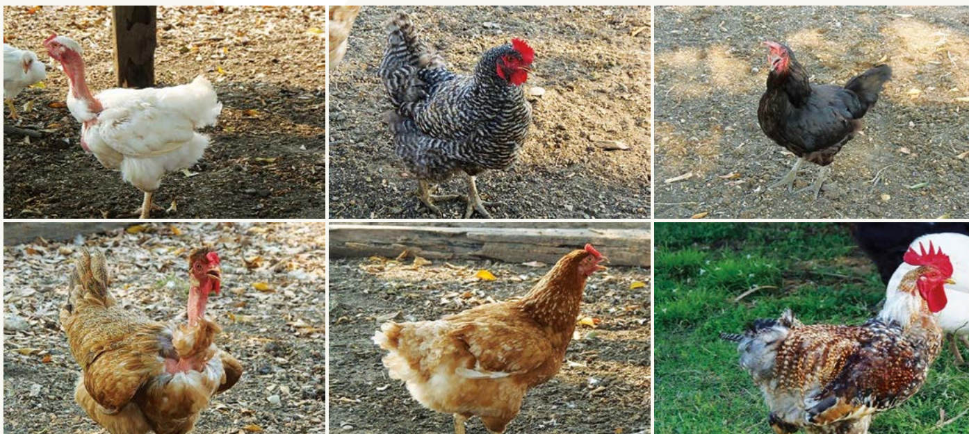
Figura 3. Algunos fenotipos de gallinas criollas ( Gallus gallus ) en México.

El gallinero generalmente está hecho de varas, barrotes, tablas y láminas; su tamaño depende de las posibilidades económicas, de la atención y necesidades de la familia (Cuca et al. , 2011). El peso de los pollitos al nacimiento varía de 25-35 g, y en estado adulto de 1 a 2.5 kg, aunque algunos gallos llegan a pesar hasta 3 kg. La madurez sexual en machos se alcanza entre las 16 y 20 semanas de edad, aunque lo ideal es utilizarlos después de 20 a 24 semanas. En general, las hembras en el traspatio se utili-