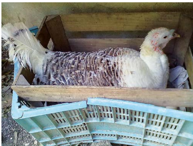
Figura 2. Incubación de huevos de guajolota.

como la Rhode Island y New Hampshire han deteriorado progresivamente su potencial genético para producir en campo abierto o pastoreo volviéndose cada vez más dependientes de insumos externos los cuales son costosos como el alimento balanceado y vacunas; se considera que esto es un error ya que las gallinas criollas han resistido enfermedades y pueden proporcionar a la investigación aves con una gran variabilidad genética útil para obtener animales resistentes. La población de gallinas criollas en México deriva de varios fenotipos entre los que se pueden señalar las gallinas avadas o empedradas, cuello pelón, amarillas, negras, coloreadas y otras menos comunes como las de plu-