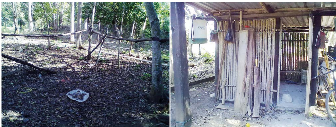
Figura 4. Gallinero rústico en un traspatio del ejido Adolfo Ruiz Cortines en el estado de Campeche, México.

zan como animales de doble propósito, es decir tanto para producción de huevo como de carne y en éstas la madurez sexual se alcanza a las 20 semanas, aunque aseveraciones de productores de traspatio señalan que estas aves rompen postura a los seis meses de edad (Cuca et al. , 2011) y la cantidad de huevo varía dependiendo del número de periodos de postura de cada hembra.