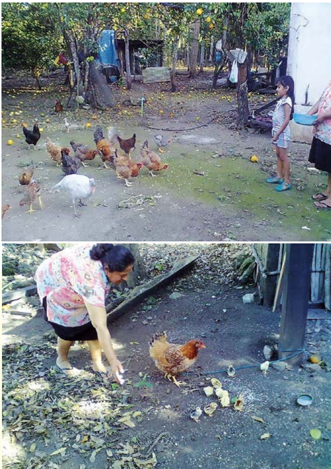
Figura 6. Alimentación de gallinas ( Gallus gallus ) en el traspatio.

casos donde los animales están en encierro y se les proporciona alfalfa ( Medicago sativa ), acahual ( Bidens odorata ) o la hierba de tototl ya sea en el suelo o colgadas. El cuidado de las aves se lleva a cabo principalmente a cargo de las mujeres, ancianos y niños (Figura 6).