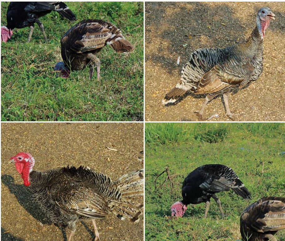
Figura 1. Diversas tonalidades de color de guajolotes ( Meleagris gallopavo ) de traspatio (Fotografías cortesía de Diego Zarate Contreras).

En México no existían las gallinas y no hay información que indique la fecha de introducción de estas al país aun cuando debió ser entre 1521 a 1525. Existe poca información relacionada con la avicultura durante la colonia, pero se sabe que se extendió por toda la Nueva España, debido a que algunos virreyes ordenaban que cada indígena debería de criar en su solar cuando menos 12 gallinas de castilla (así llamaban a las gallinas) y la mitad de gallinas de tierra (nombre dado a los guajolotes), parte de estas servían para pagar el tributo a los conquistadores (Oteiza, 1997). Este mismo autor menciona que la avicultura satisfizo la demanda en la época colonial, durante la lucha por la independencia se redujo la producción de huevo y carne de gallina, posteriormente debió aumentar, nuevamente en los años que duró la revolución disminuyó para volver a incrementarse hasta llegar a lo que se tiene actualmente en el traspatio. Es importante mencionar que las epizootias eran frecuentes y virulentas, pero a través de los siglos y a pesar de la mortandad, las gallinas introducidas por los españoles han logrado sobrevivir, actualmente las gallinas criollas de los campesinos se han cruzado sucesivamente con pollos provenientes de los sistemas comerciales, que aunado a la introducción de paquetes de aves "mejoradas"