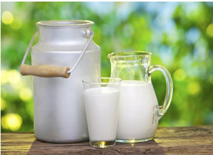
Figura No 1. La leche puede ser un vehículo de trasmisión de enfermedades.