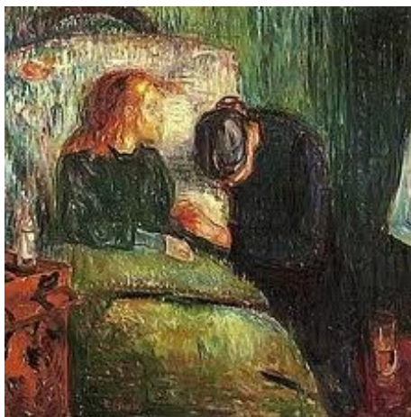
Figura 2. A criança doente – Edvard Munch, 1885-1886.