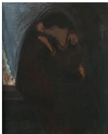
Figura 4. O beijo – Edvard Munch, 1897

definitivamente à necessidade de representar as coisas e seres de forma clara e fiel a dita “realidade”. Numa leitura psicanalítica, esta falta de fronteira entre a figura humana e o ambiente ganha uma possibilidade a mais, a de uma experiência onde o Real invade dissolvendo a unidade imaginária do “eu” e a construção do corpo enquanto “total”, deixando o ser despedaçado, totalmente atravessado pela angústia. Esta experiência pode acometer a qualquer sujeito ao longo da vida, independente da estrutura psíquica, porém é mais típica da estrutura psicótica, onde as construções imaginárias que sustentam o eu são mais frágeis.