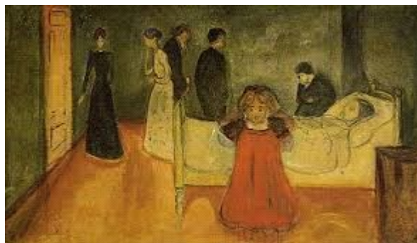
Figura 1. A mãe morta e a criança (1ª versão). Edvard Munch, 1899.

palavras; foi algo que pairou sobre o pintor como uma sombra durante toda a sua vida. Esta morte foi constantemente retratada em seus quadros, tais como A morte na câmara da doente de 1895, O leito de morte , também de 1895 e A mãe morta e a criança de 1899. Munch retornou a estes quadros em vários momentos da vida, pintando várias versões deles e os trabalhando também na modalidade de xilogravura. Quanto ao quadro A mãe morta e a criança Munch assume em anotação deixada em seu diário que a criança que comparece dando as costas a cena e tapando os ouvidos com uma expressão de extrema angústia era ele mesmo.