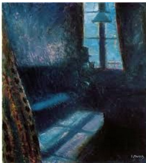
Figura 3. Noite de Saint-Cloud – Edvard Munch, 1890.

Em 1889 Munch realizou na capital da Noruega a sua primeira exposição individual que contou com cento e dez obras. Apesar de ser criticado por artistas conservadores, Munch obteve reconhecimento dos seus colegas do círculo boêmio e conseguiu uma bolsa estatal para voltar a estudar em Paris. Chegando em Paris, Munch recebe a notícia da morte de seu pai, mas decide não voltar para a Noruega a fim de lhe prestar as homenagens, pois se recusa a se deparar com a imagem do cadáver de seu pai. Muito abalado pela morte do pai Munch pinta a tela Noite de Saint-Cloud .