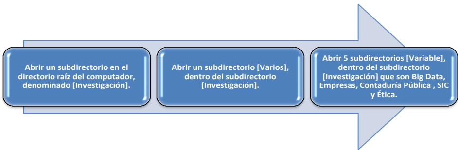
Gráfico 1. Procedimiento de apertura de los directorios necesarios para almacenar documentos. Fuente: Elaboración propia.

Los datos cualitativos obtenidos de los autores, deben ser agrupados de acuerdo con cada variable que son: Big Data , Contadores Públicos, Empresas, SIC y Ética, para realizar el análisis crítico y de interpretación y poder contar con criterios que en conjunto forman parte de los resultados y conclusiones que serán discutidos en esta investigación. Véanse las figuras 1, 2 y 3, que forman parte del modelo de herramientas utilizadas para la captura de los datos cualitativos. Los sitios de donde se recuperan los artículos, se utilizan para los datos de las referencias bibliográficas.