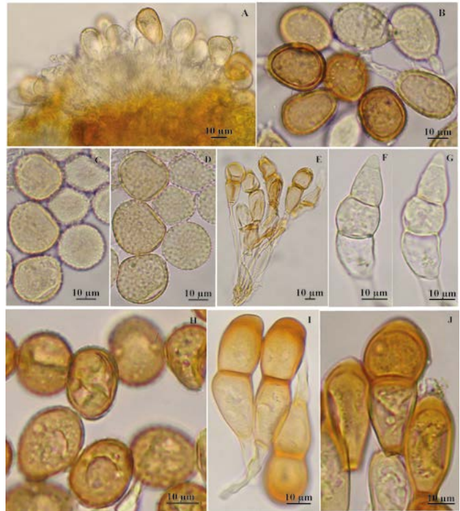
Figura 1. A-B. Puccinia caricina . A. Aspecto general del uredinio. B. Uredosporas con poros ecuatoriales (flecha). C-G. Puccinia cephalotes . C-D. Uredosporas. C. Vista superficial. D. Vista mediana. E-F. Teliosporas. E. Teliosporas de dos células. F. Teliosporas de tres células. H-J. Puccinia dioicae . H. Uredosporas con poros ecuatoriales (flecha). I-J. Teliosporas. I. Teliosporas de dos células. J. Mesosporas.

Espermogonio y ecio no observados. Uredinio en Uredo , soros en su mayoría hipófilos, ocasionalmente en los pedúnculos de la espiga, inicialmente cubiertos por la epidermis, alargados, de color marrón-canela a marrón-amarillento, con ruptura posterior, longitudinal, de pulverulentos a compactos; uredosporas en su mayoría elipsoides, alargadas, de tamaño variable, 22-38 x 17-25 µm; pared color marrón-canela a marrón-amarillento, hasta 2.5 µm de espesor uniforme, con equinulas dispersas, cortas; poros germinativos 2-4 ecuatoriales.