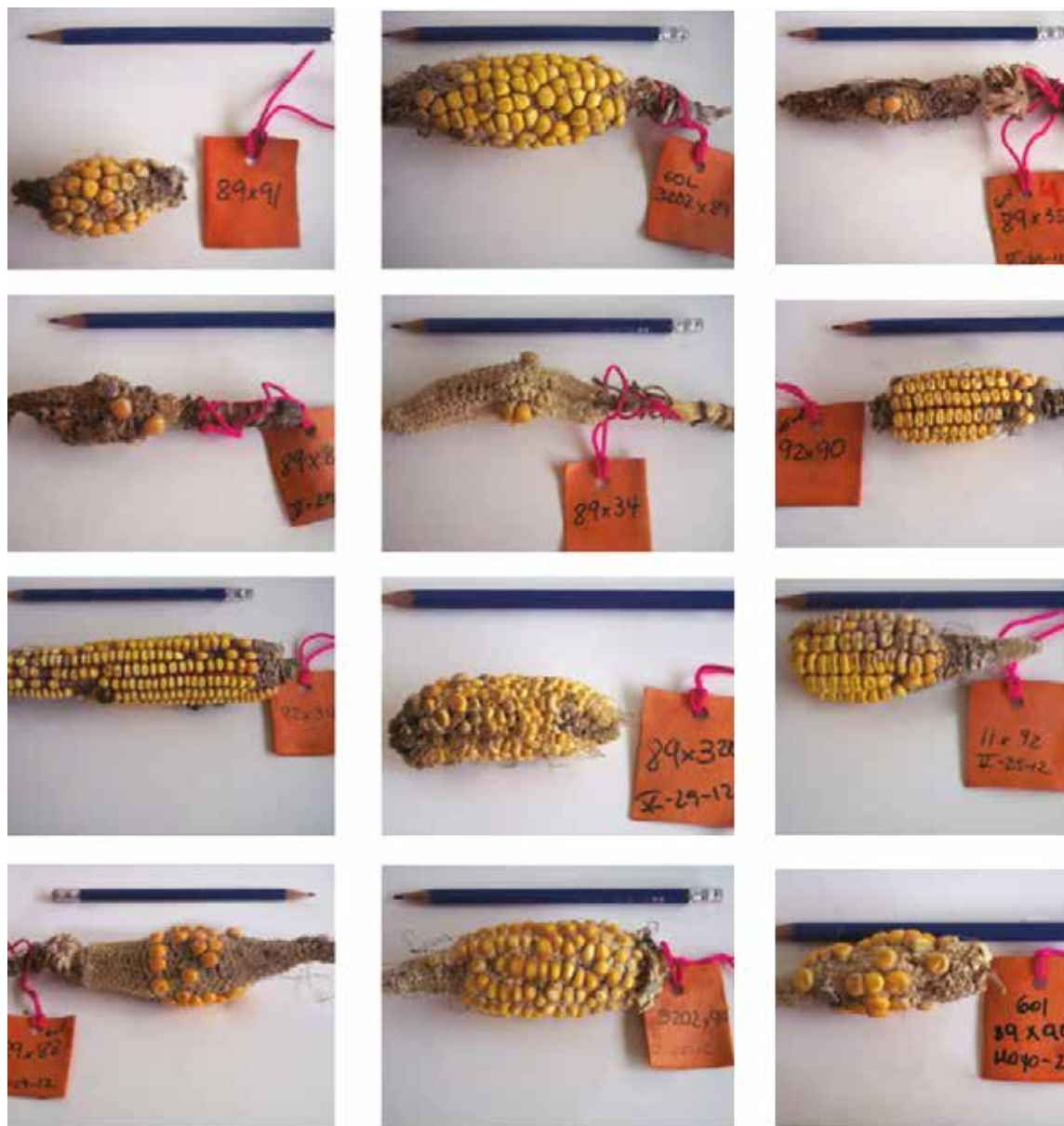
Foto 4. Formación de mazorcas producto del cruzamiento entre accesiones nativas de maíz procedentes del departamento del Magdalena, Colombia. Los números en etiquetas corresponden a accesiones evaluadas.

La diversidad de procedencia de las accesiones y los contrastantes de climas en sus sitios de origen generaron dificultades para la regeneración de la semilla y la formación de los cruzamientos en el Centro Agrícola y Forestal. El sitio de origen de este grupo de accesiones es diverso y va desde Fundación, Pivijay, Ciénaga hasta San Pedro de la Sierra (Cuadro 1). El departamento del Magdalena tiene orografía contrastante, así, Santa Marta se encuentra a 2 m.s.n.m. y el clima del Centro Experimental se clasifica como desértico.