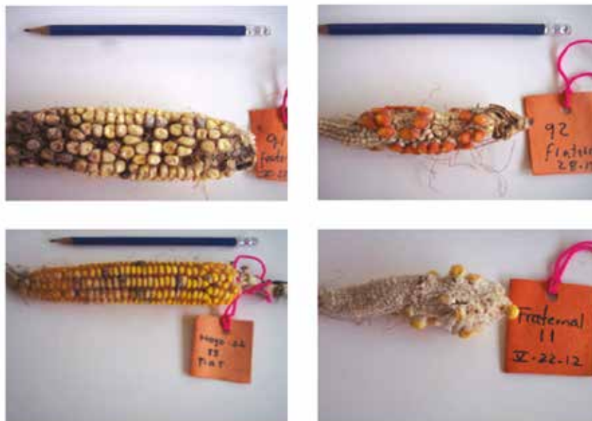
Foto 2. Formación de mazorcas como producto del cruzamiento entre plantas hermanas de accesiones nativas de maíz procedentes del departamento del Magdalena, Colombia.

de Pivijay), 88 (de Fundación) y 92 (de Ciénaga) presentaron buenos incrementos de semilla por ambos métodos. Estos resultados muestran la ausencia de un comportamiento uniforme de las accesiones debido a su proveniencia de diferentes ambientes dentro del departamento del Magdalena (Foto 2).