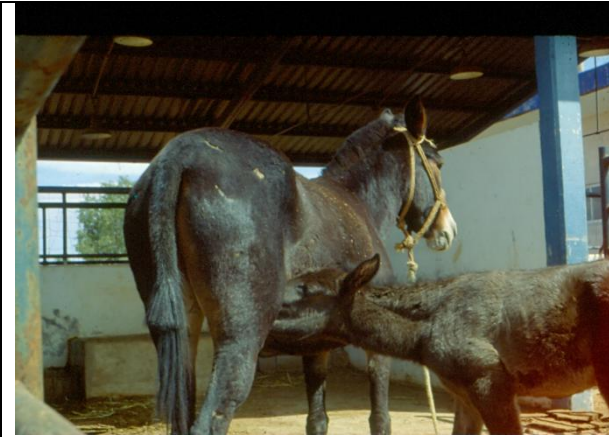
Fotografía 1 de la Mula fértil y su cría de Ojocaliente Zacatecas México. A dos semanas de parida en las instalaciones de la UAMVZ-UAZ. Así como los cariotipos y cariogramas.