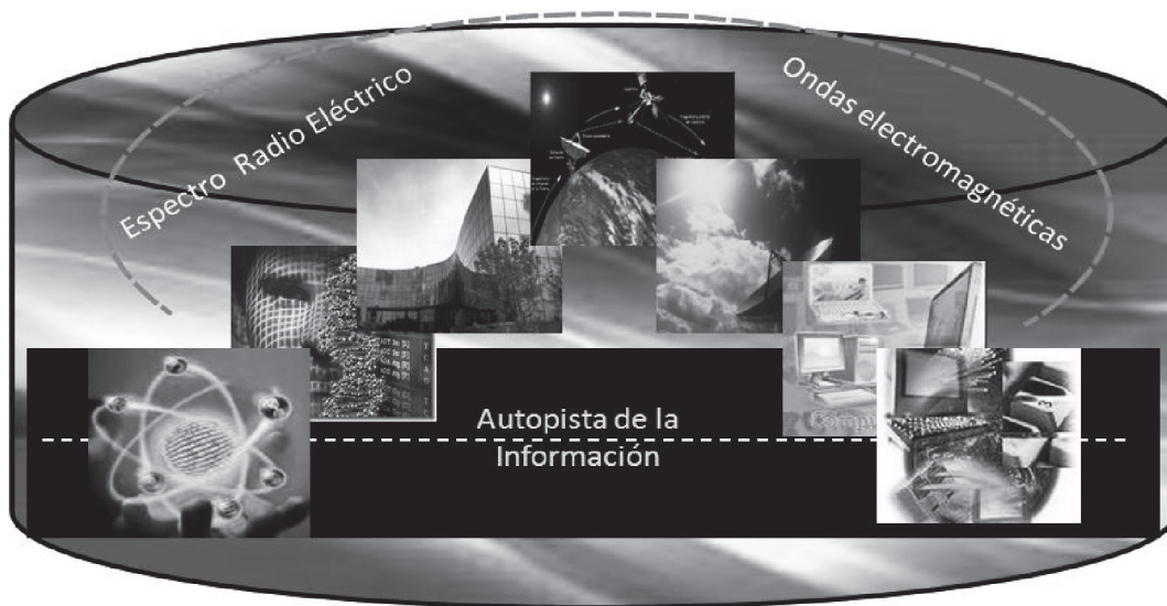
Figura N° 2. >>> Integración tecnológica en la sociedad y organización

empresas e instituciones deben tener, los cuales se denominan recursos materiales computarizados y conforman el entorno tecnológico de las mismas (figura 2). La relación existente entre los ciudadanos y las organizaciones en el ciberespacio, operan mediante las autopistas de la información y en las empresas debe existir alguna de éstas para operar de manera normal, garantizando, por supuesto, su seguridad. Las autopistas de la información proliferaron de manera tal que se hacen indispensables para cualquier decisión a priori o posteriori. Esta vía, llamada también “en línea” ( on line ), la integran lo digital y lo analógico enlazado con los medios de comunicación tales como internet, telefonía (fija y móvil), televisión y radio, lo cuales operan integrados a la red multimedia.