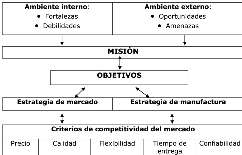
Figura No 2. Elementos de una Estrategia Competitiva

■ Fuente: Rosales, R. (1996:104) Elementos de una estrategia competitiva y sus alcances estratégicos