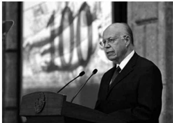
Doctor José Narro Robles, rector de la UNAM.

Frente al ciclo presupuestal que ya inició, con igual respeto pido a la Honorable Cámara de Diputados que se incrementen los recursos destinados a las universidades públicas federales y estatales, a la ciencia y la cultura, además de que el destinado a la UNAM se mantenga en los términos presentados por el Ejecutivo Federal, que mucho reconocemos. Al hacerlo se fortalecerá a las instituciones y se invertirá en el presente y el futuro del país: en su juventud.