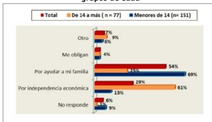
Gráfico 1: Razones que motivan su decisión de trabajar de los niños y adolescentes por grupos de edad