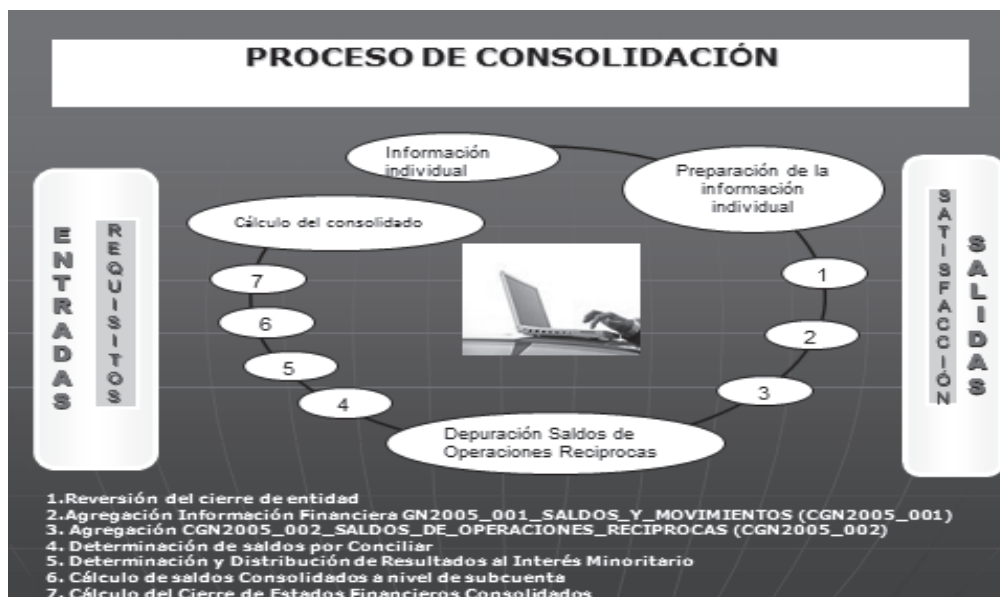
Tabla 2. Elaborada por Contaduría General de la Nación.

Consolidador de Hacienda e Información Financiera Pública (CHIP), definido como: “...un sistema compuesto por un conjunto de procesos e instrumentos requeridos para la generación, transmisión, procesamiento y publicidad de información financiera pública...” 8