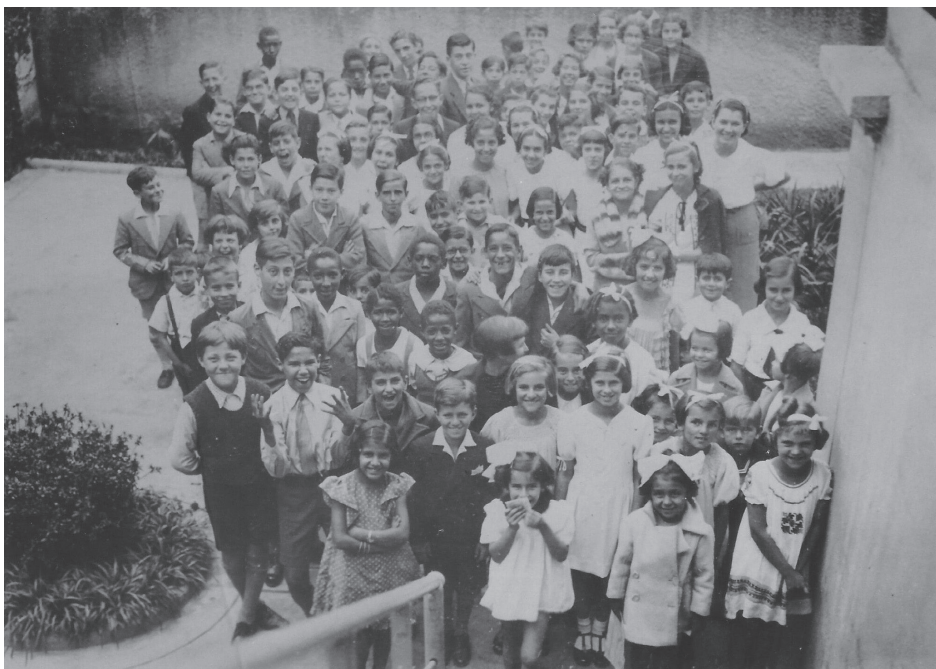
Figura 1. Crianças esperam pela sessão de cinema na Biblioteca Infantil