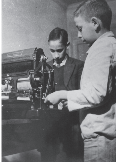
Figura 4. Crianças imprimem o jornal A Voz da Infância em um mimeógrafo