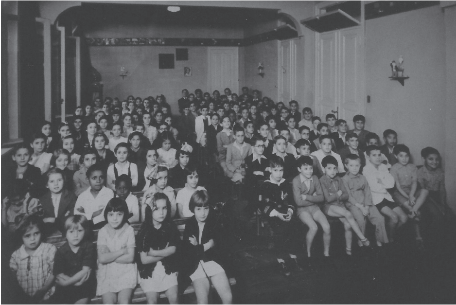
Figura 2. A Sala de Projeção da Biblioteca Infantil repleta de crianças