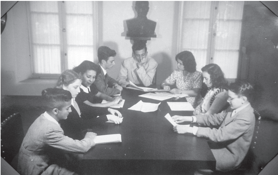
Figura 5. Reunião da Diretoria do Jornal A Voz da Infância