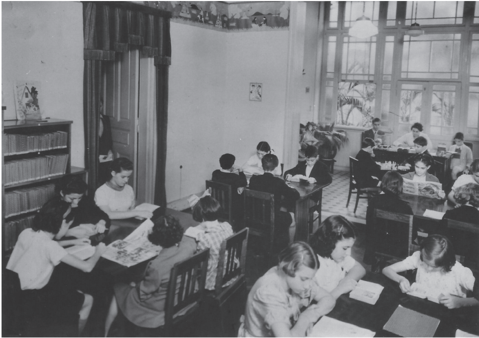
Figura 3. Meninos e meninas na sala de leitura