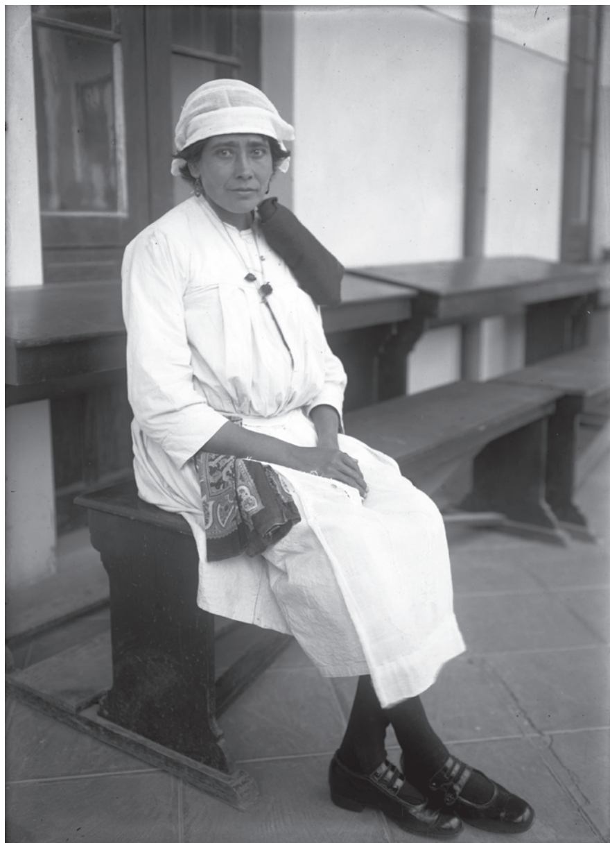
"Mujer, retrato" (placa seca de gelatina: 12.7 x 17.8 cm.), México, D.F. ca. 1915-1920.