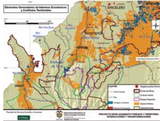
Figura 2. Elementos generadores de intereses económicos y conflictos territoriales

hacer mercado y ahí era cuando uno más se enteraba. (Esperanza, 37 años) 9 .