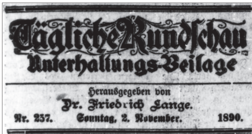
Figura 2. Cabecera del periódico alemán Tägliche Rundschau , del domingo 2 de noviembre de 1890