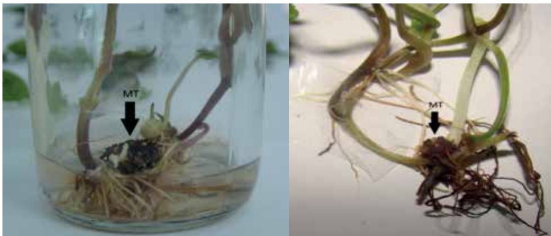
Figura 1: Plantas de ñame in vitro con formación de microtúberos en la base del tallo (MT).

La formación de microtubérculos se observó en plantas cultivadas en medio con dosis altas ( 2,0 \text{ mg L}^{-1} y 3,0 \text{ mg L}^{-1} ) de ABA, mientras que en aquellas cultivadas en medio con \leq 1 \text{ mg L}^{-1} de ABA no se formaron estas estructuras. El mayor porcentaje de microtuberización (65%) se observó en las plantas cultivadas en el medio MS con 60 \text{ g L}^{-1} de sacarosa y 3,0 \text{ mg L}^{-1} ABA, seguido por las plantas cultivadas en los medios que contenían 60 \text{ g L}^{-1} de sacarosa y 2,0 \text{ mg L}^{-1} ABA (13%) y las cultivadas en presencia de 30 \text{ g L}^{-1} de sacarosa con 2,0 \text{ mg L}^{-1} ABA, y 90 \text{ g L}^{-1} de sacarosa combinada con 3,0 \text{ mg L}^{-1} ABA (11%) (Figura 2).