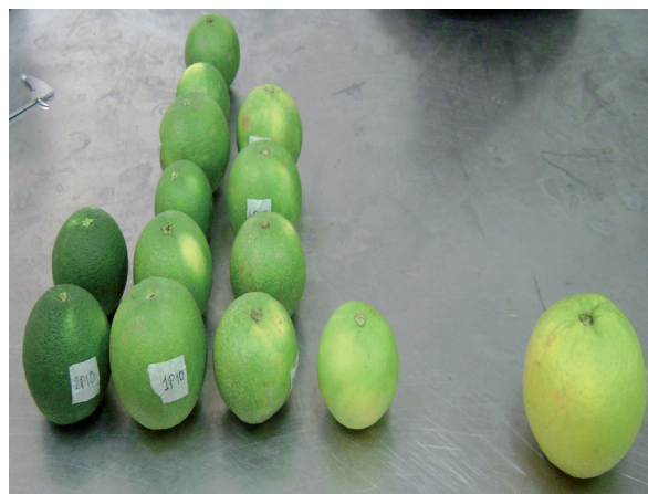
Figura 3. Colores según estados de de madurez de naranja valenciana ( C. sinensis Osbeck). Mandinguilla (Chimichagua)

En términos generales, con estado de madurez cero e incluso cuando aún no ha logrado éste